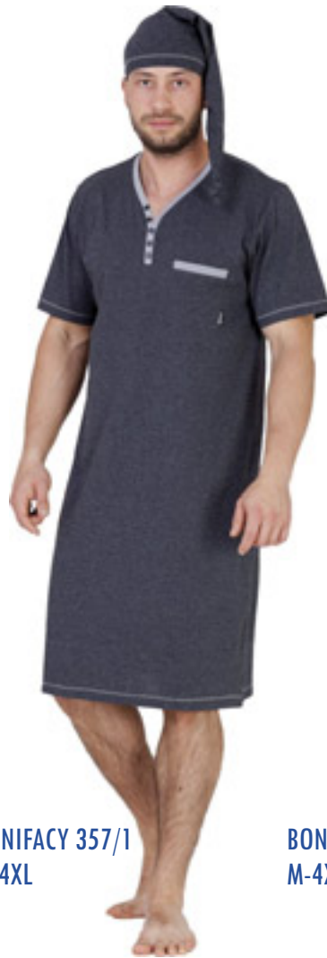
BONIFACY 357/1 M-4XL