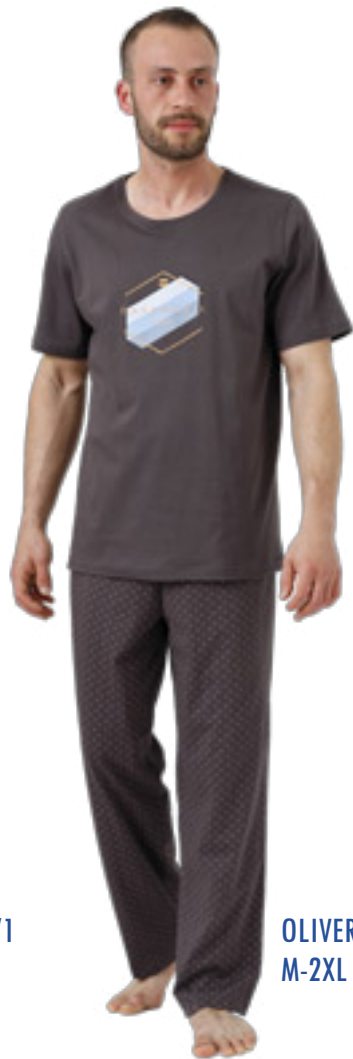
OLIVER 994/2 M-2XL