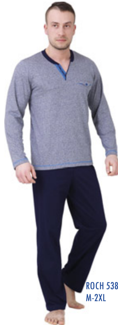
ROCH 538/2 M-2XL