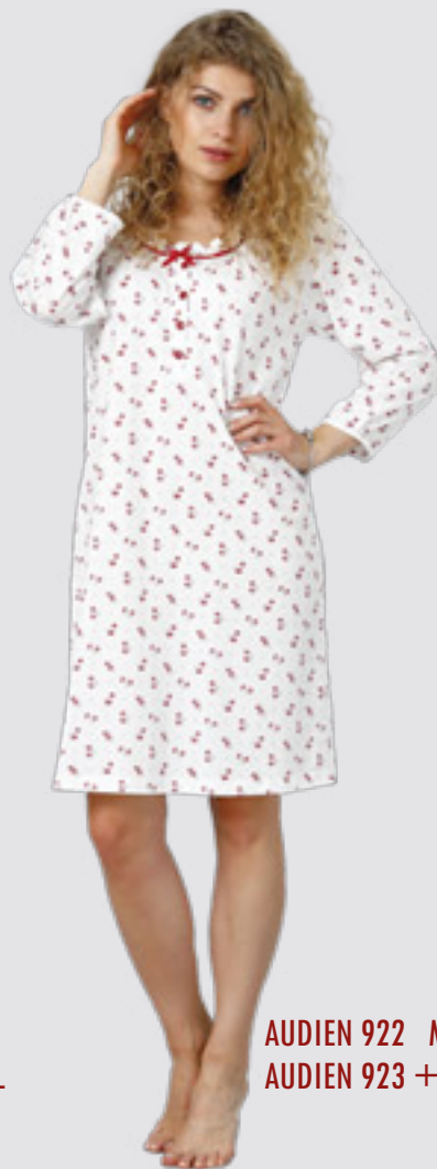
AUDIEN 922 M - 2XL AUDIEN 923 ++SIZE 3XL - 4XL