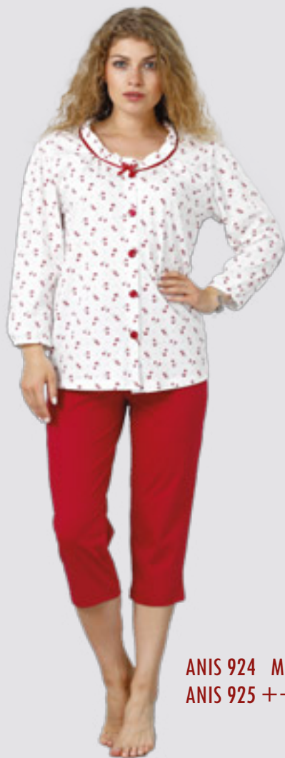
ANIS 924 M - 2XL ANIS 925 ++SIZE 3XL - 4XL