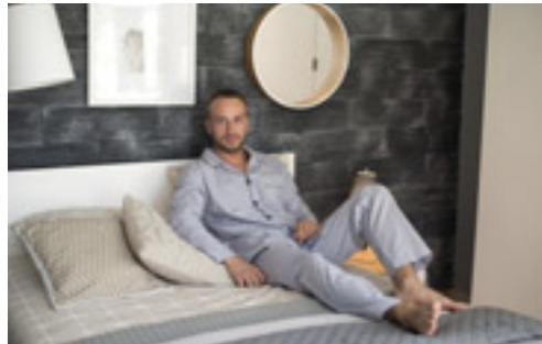
Klasyka i elegancja