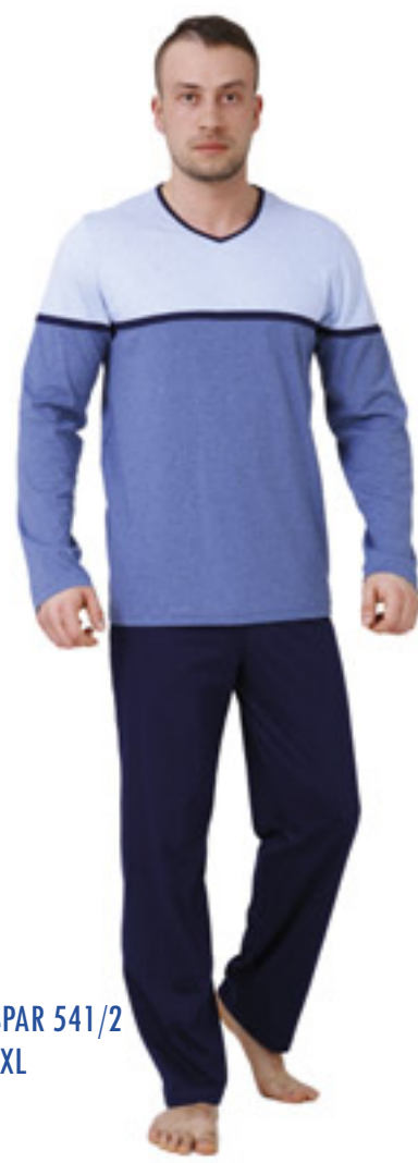
GASPAR 541/2 M-2XL