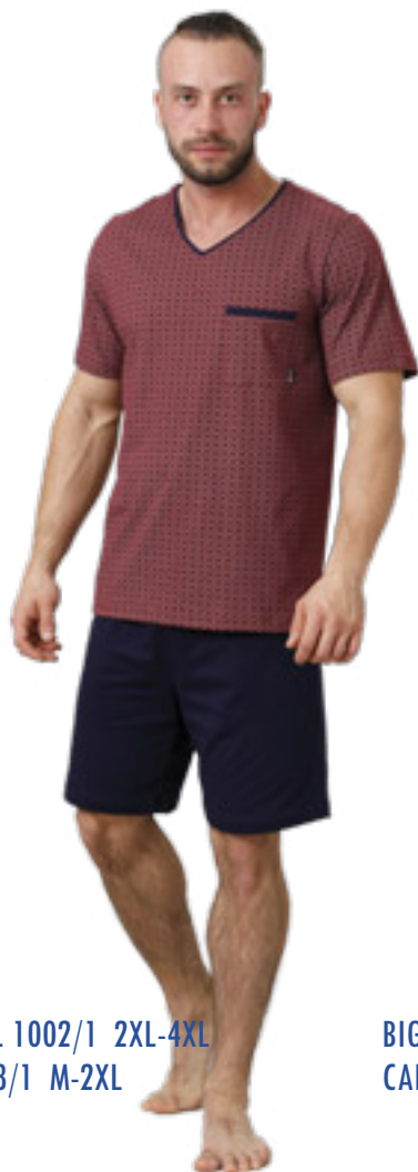
BIG CARL 1002/1 2XL-4XL CARL 888/1 M-2XL