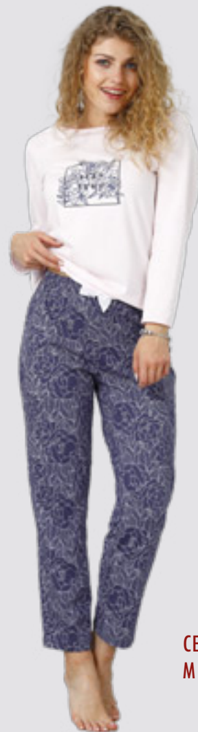
CELESTE 950 M - 2XL