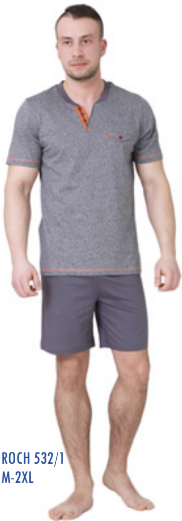
ROCH 532/1 M-2XL