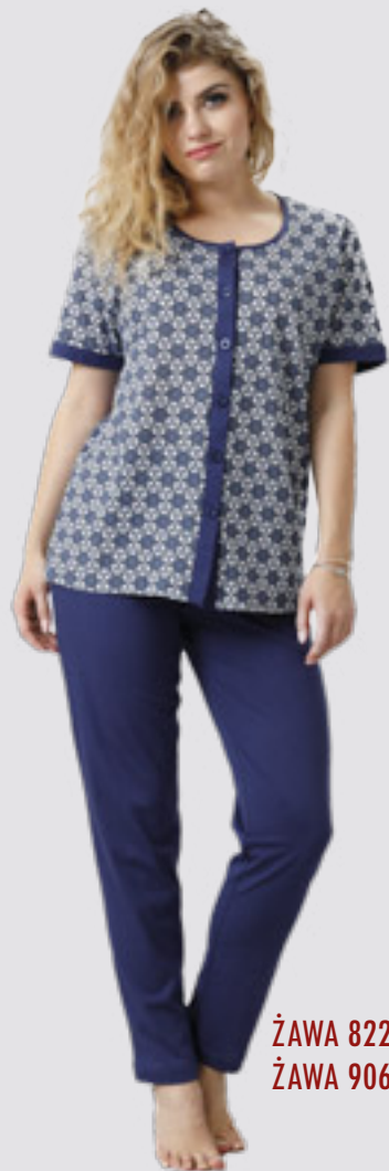
ŽAWA 822 M - 2XL ŽAWA 906 ++SIZE 3XL - 4XL