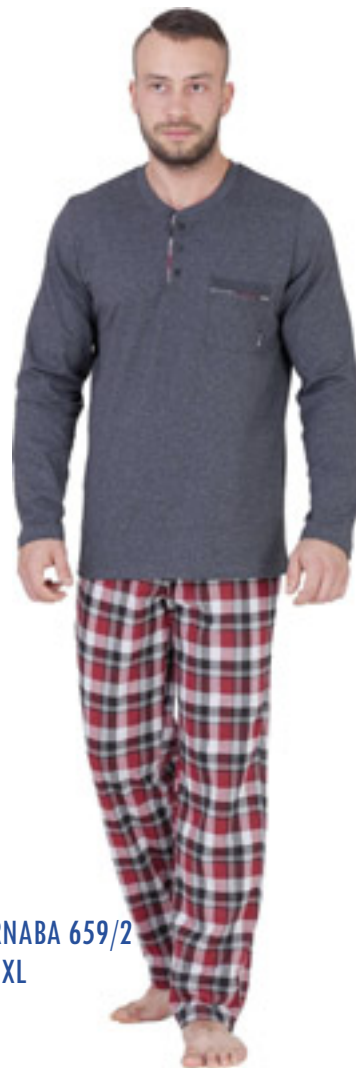
BARNABA 659/2 M-2XL