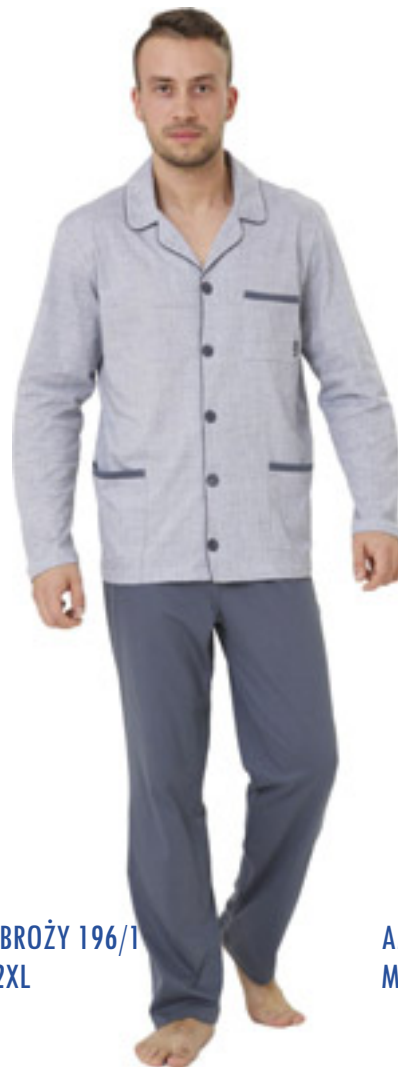
AMBROŻY 196/1 M-2XL