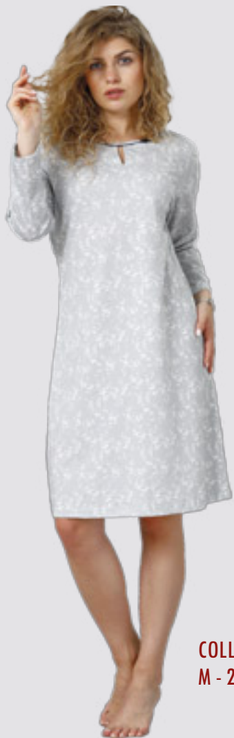
COLLEN 936 M - 2XL