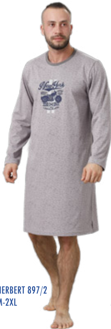
HERBERT 897/2 M-2XL