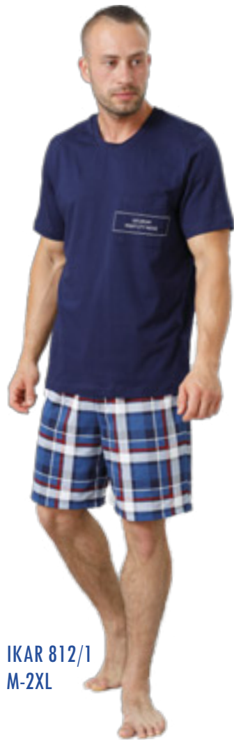
IKAR 812/1 M-2XL