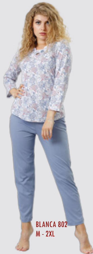
BLANCA 802 M - 2XL