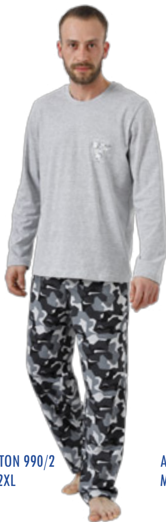
ANTON 990/2 M-2XL