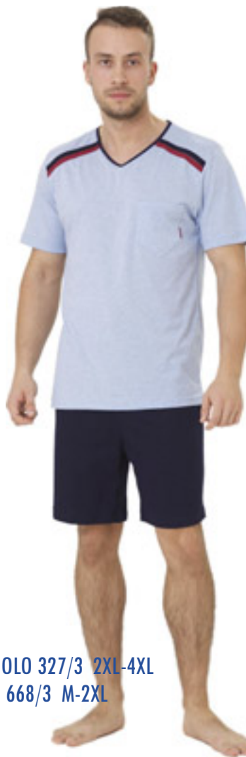
BIG OLO 327/3 2XL-4XL OLO 668/3 M-2XL