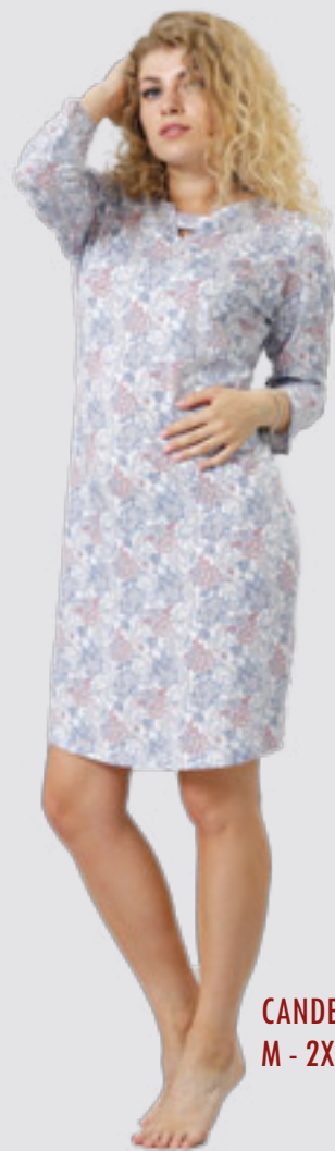
CANDE 803 M - 2XL