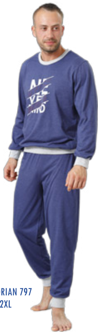
ADRIAN 797 M-2XL