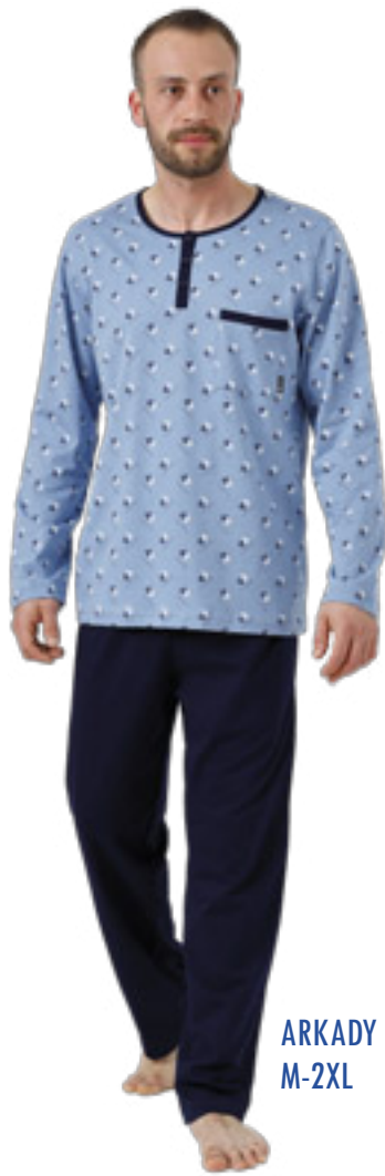
ARKADY 988/1 M-2XL