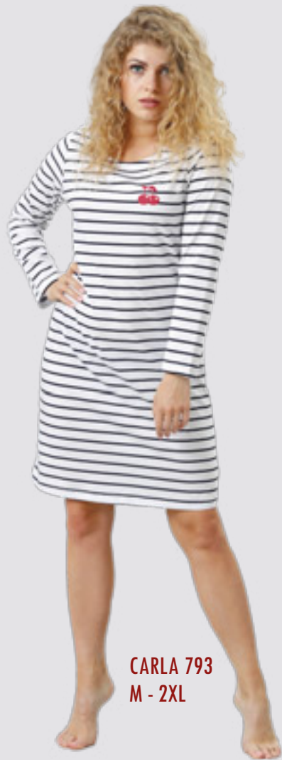
CARLA 793 M - 2XL