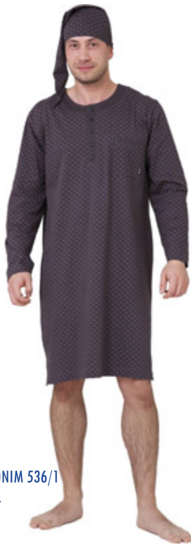
HIERONIM 536/1 M-4XL