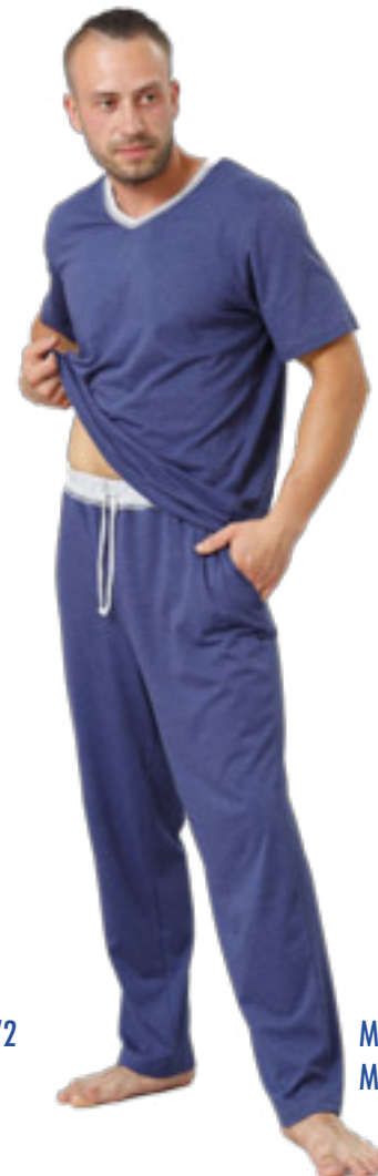
MATIAS 816 M-2XL