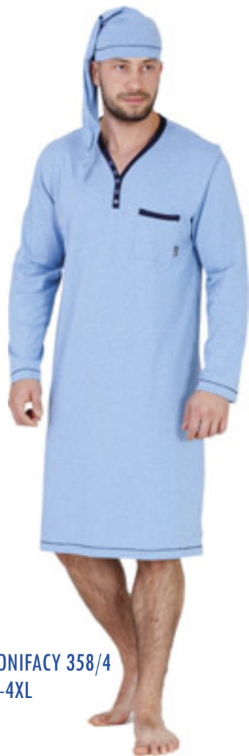
BONIFACY 358/4 M-4XL