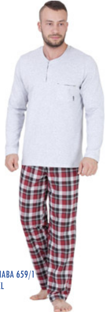
BARNABA 659/1 M-2XL