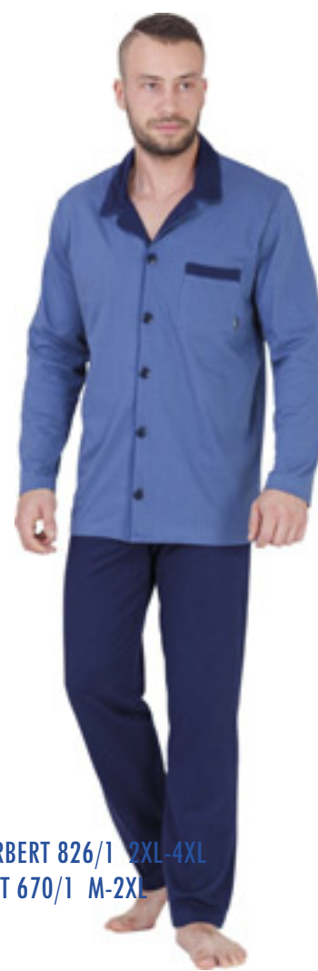
BIG NORBERT 826/1 2XL-4XL NORBERT 670/1 M-2XL