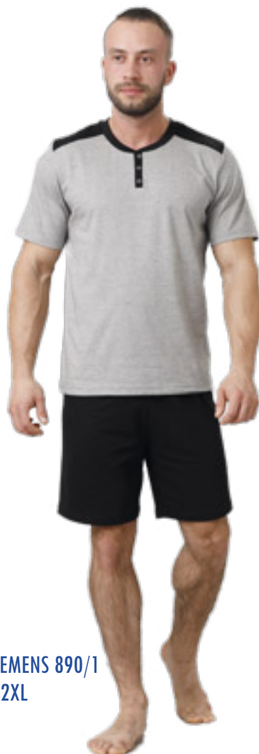
CLEMENS 890/1 M-2XL