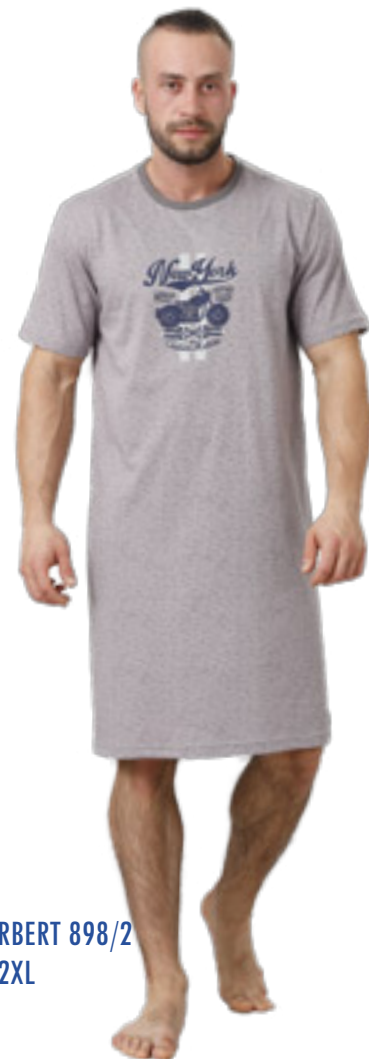
HERBERT 898/2 M-2XL