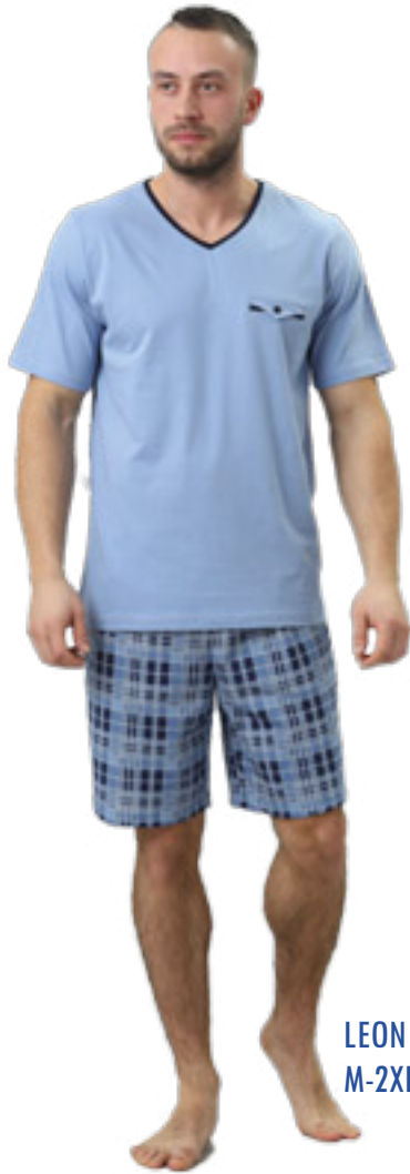
LEON 710/1 M-2XL