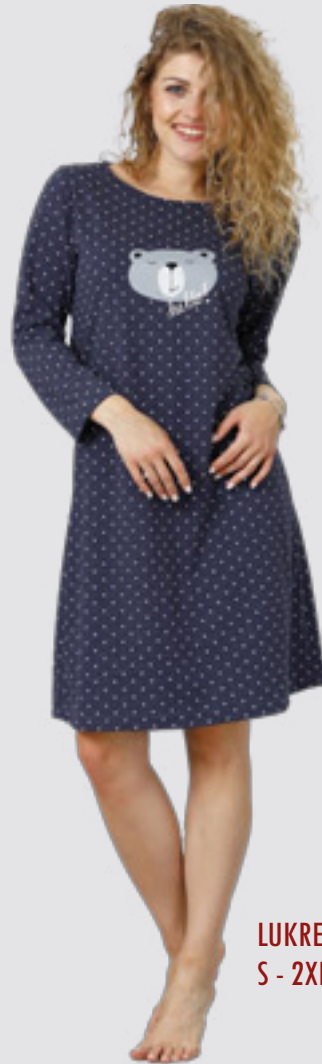
LUKRECJA 927 S - 2XL