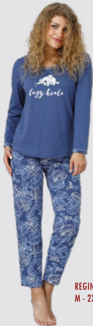
REGINA 932 M - 2XL