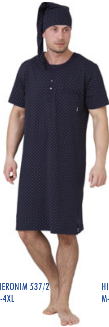
HIERONIM 537/2 M-4XL