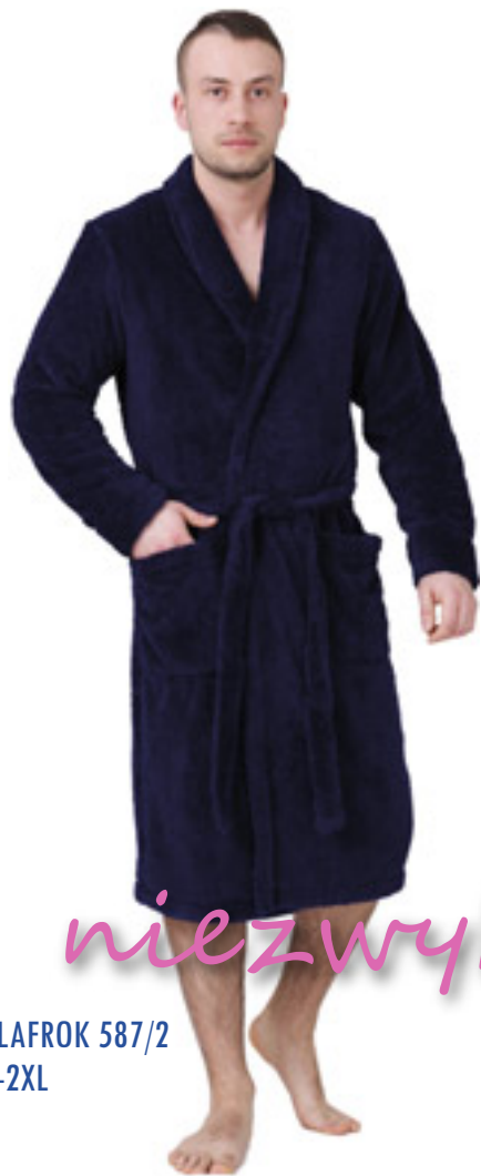
SZLAFROK 587/2 M-2XL