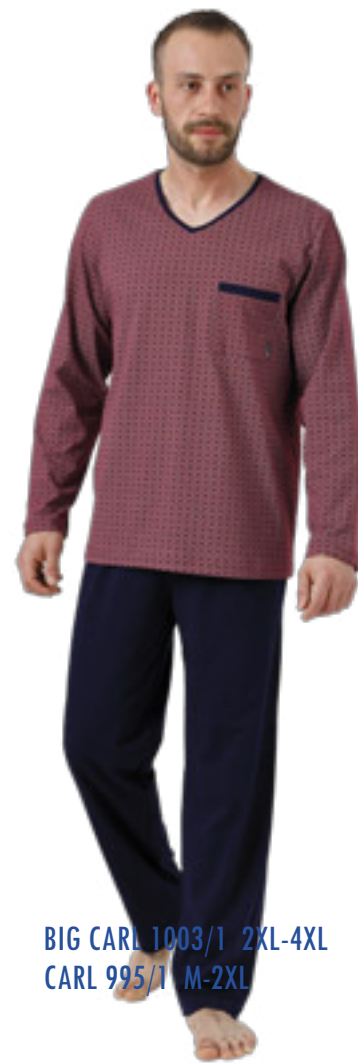
BIG CARL 1003/1 2XL-4XL CARL 995/1 M-2XL