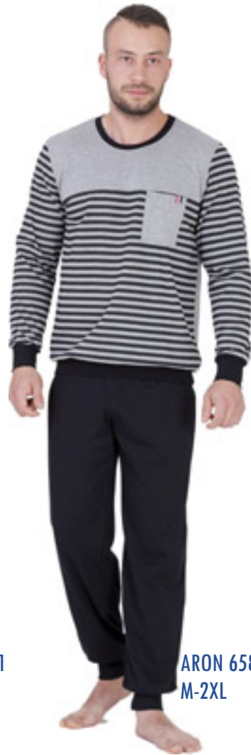
ARON 658/1 M-2XL