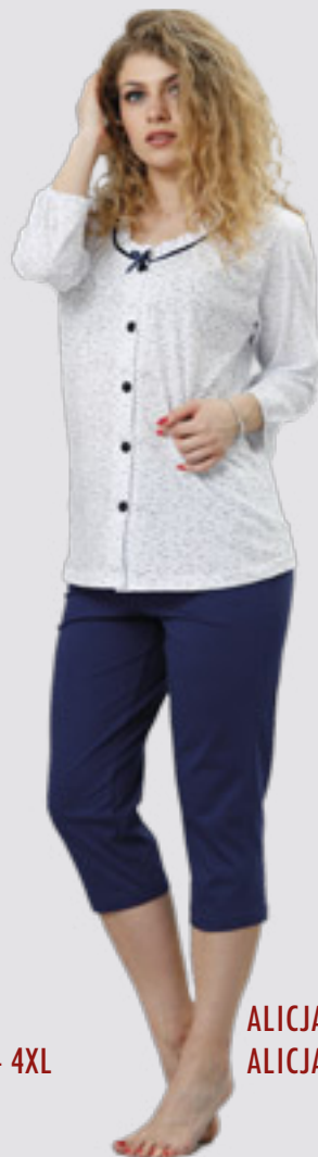
ALICJA 774 M - 2XL ALICJA 823 ++SIZE 3XL - 4XL