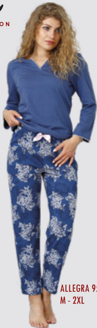
ALLEGRA 953/2 M - 2XL