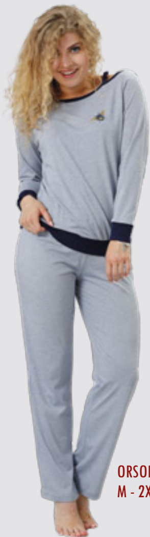
ORSOLA 817 M - 2XL