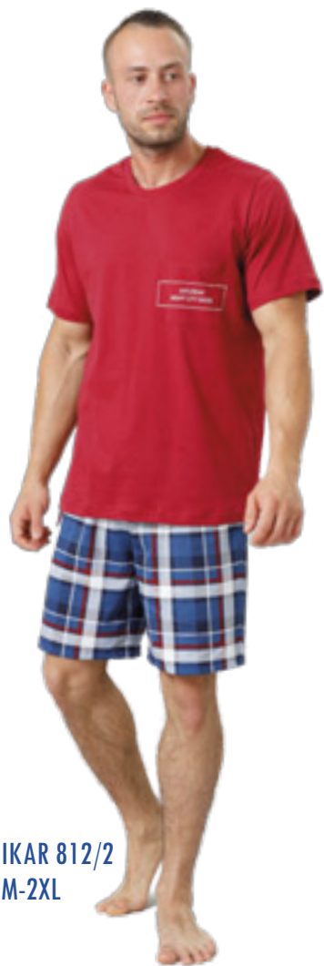
IKAR 812/2 M-2XL