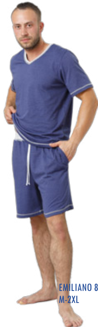
EMILIANO 808/2 M-2XL