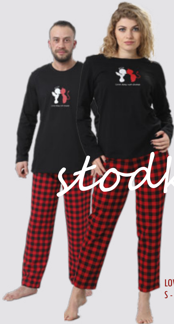
LOVLA 909 S - 2XL