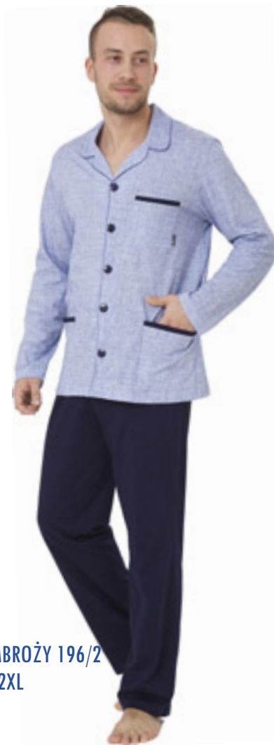
AMBROŻY 196/2 M-2XL