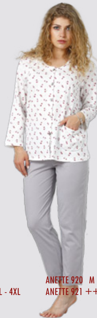
ANETTE 920 M - 2XL ANETTE 921 ++SIZE 3XL - 4XL