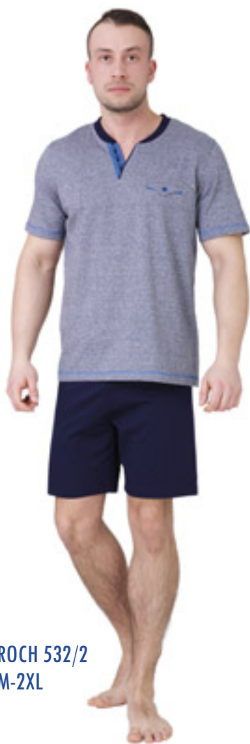
ROCH 532/2 M-2XL