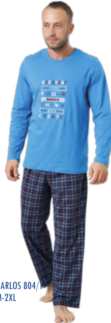
CARLOS 804/1 M-2XL