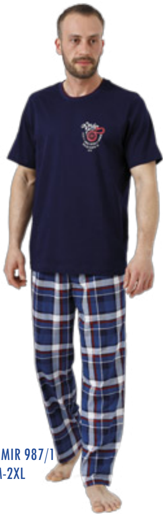
AMIR 987/1 M-2XL