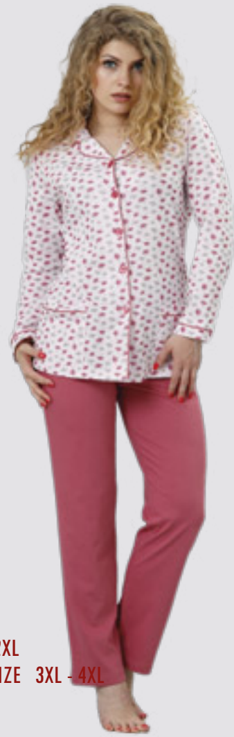
RICA 770 M - 2XL RICA 824 ++SIZE 3XL - 4XL