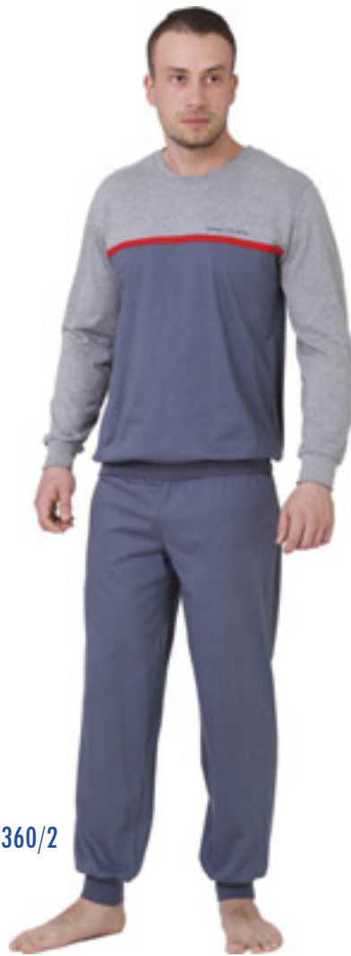
KASJAN 360/2 M-2XL