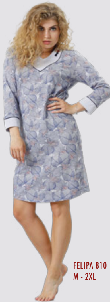
FELIPA 810 M - 2XL