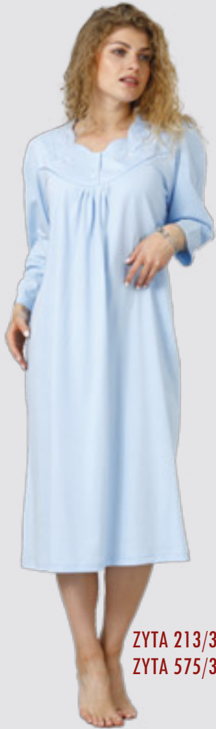
ZYTA 213/3 M - 2XL ZYTA 575/3 ++SIZE 3XL - 4XL