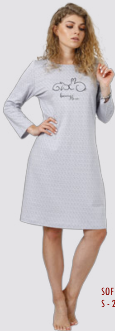
SOFIJA 958 S - 2XL