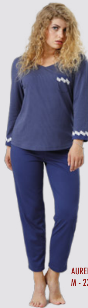
AURELIA 801 M - 2XL