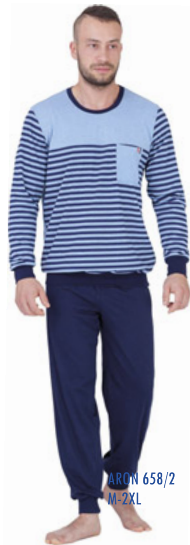
ARON 658/2 M-2XL