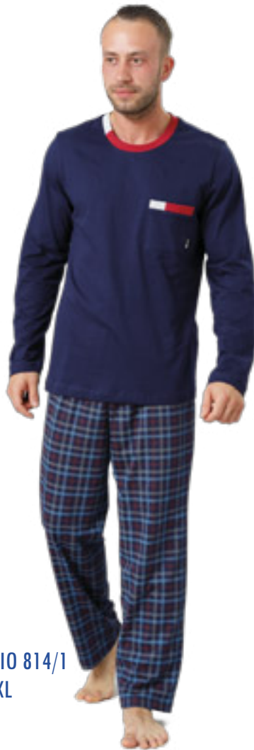
MARIO 814/1 M-2XL