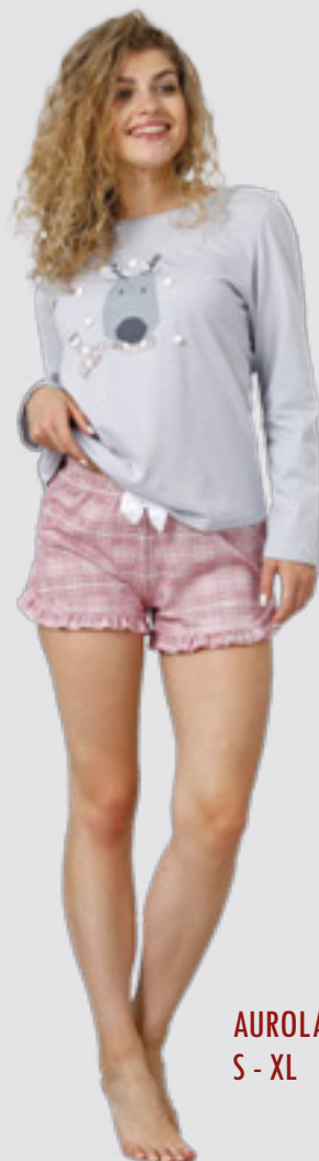
AUROLA 983 S - XL