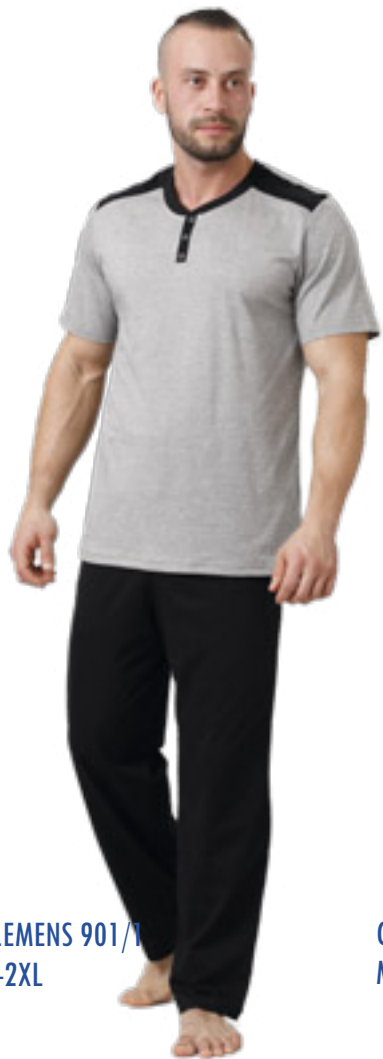
CLEMENS 901/1 M-2XL