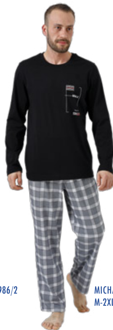
MICHAEL 986/1 M-2XL