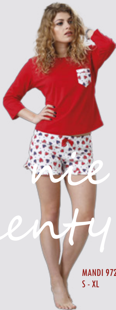
MANDI 972 S - XL