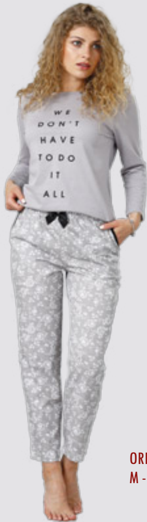
ORIA 943 M - 2XL