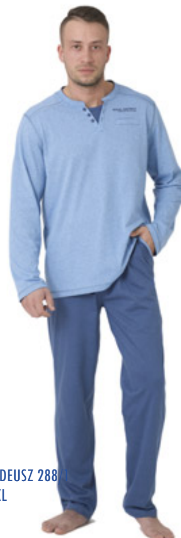
AMADEUSZ 288/1 M-2XL