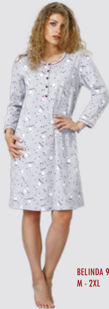
BELINDA 945 M - 2XL