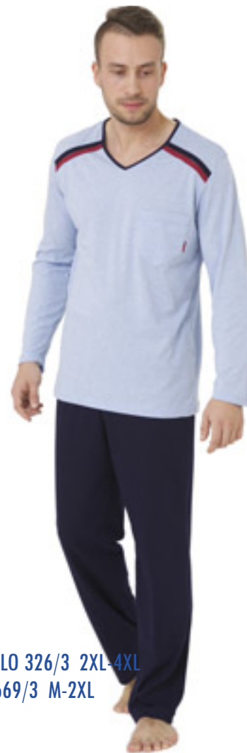
BIG OLO 326/3 2XL-4XL OLO 669/3 M-2XL