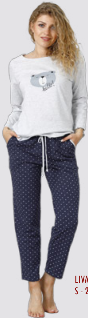
LIVANA 928 S - 2XL