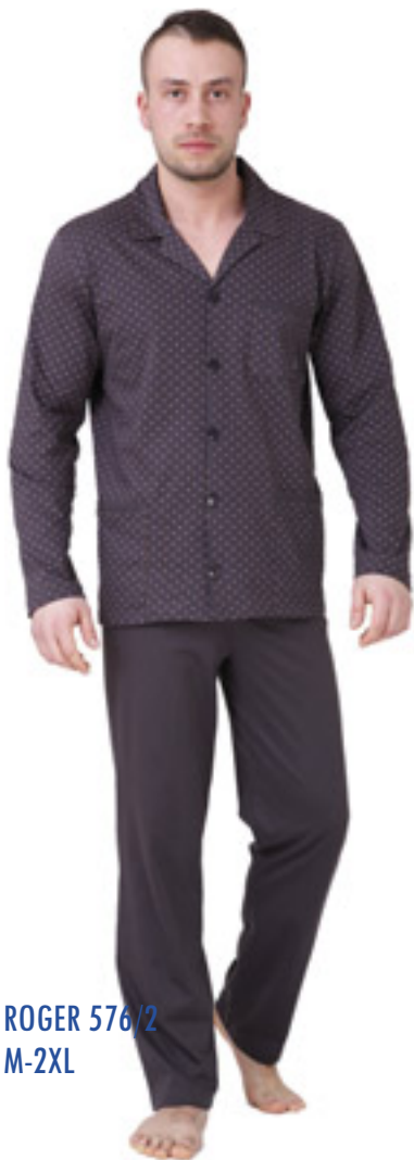
ROGER 576/2 M-2XL