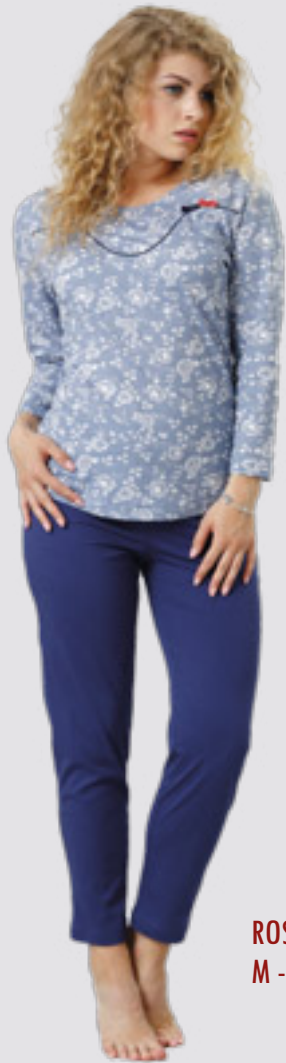
ROSSA 796 M - 2XL