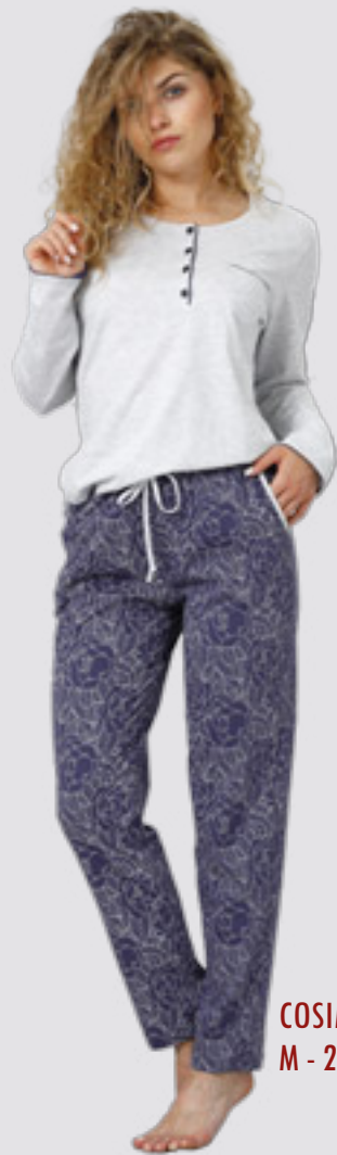
COSIMA 951 M - 2XL