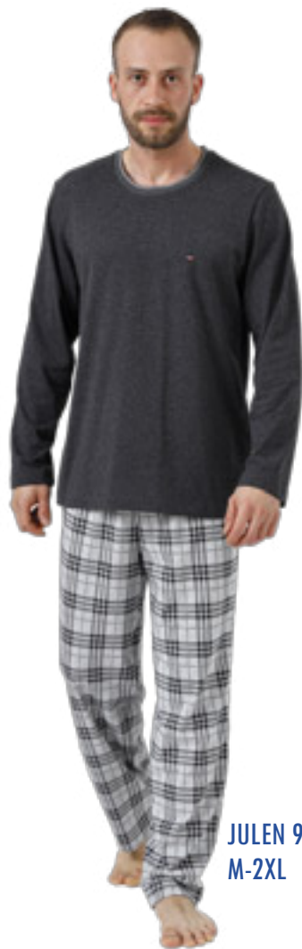
JULEN 992/1 M-2XL