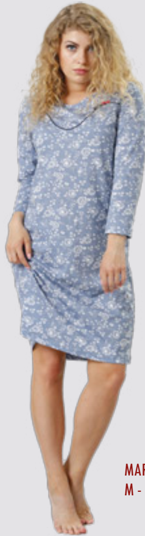
MARGHERITA 795 M - 2XL