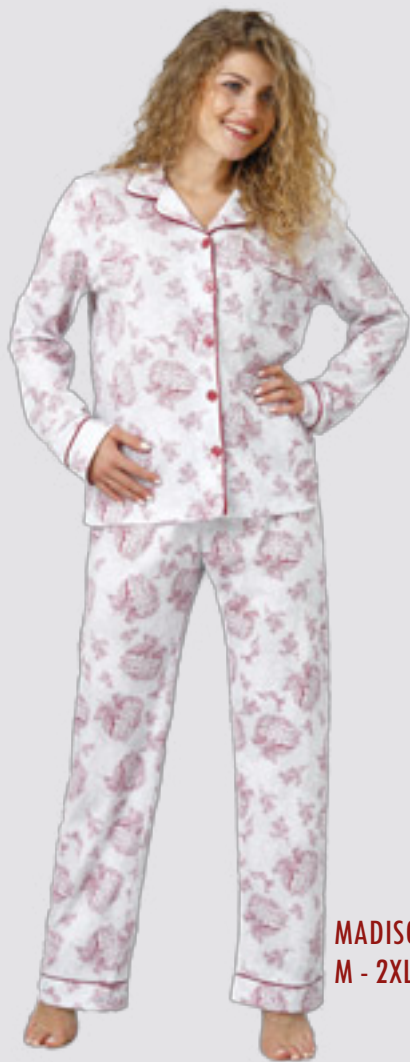
MADISON 931 M - 2XL