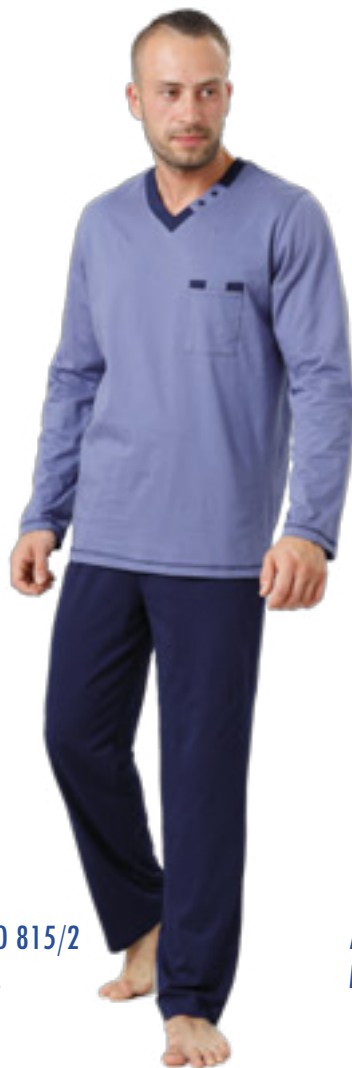
MATEO 815/2 M-2XL