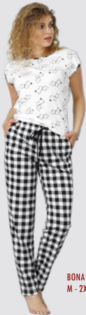
BONA 873 M - 2XL