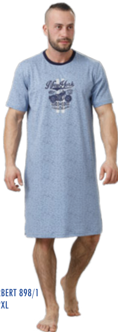
HERBERT 898/1 M-2XL