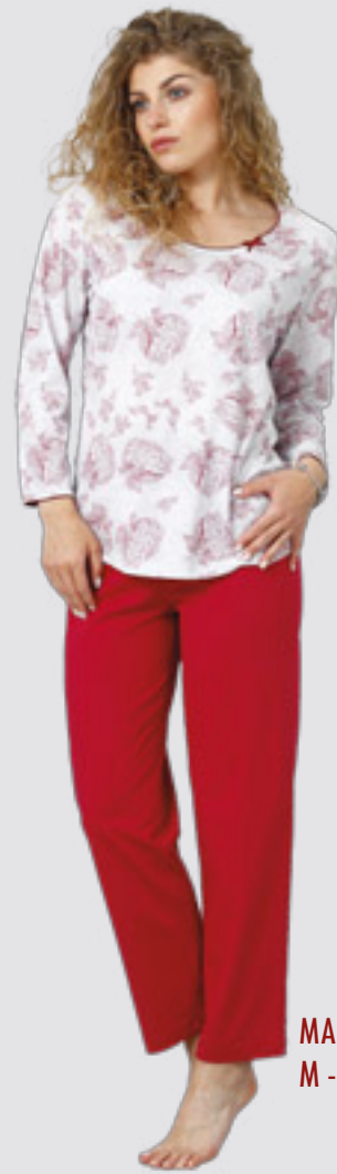
MARTINA 929 M - 2XL