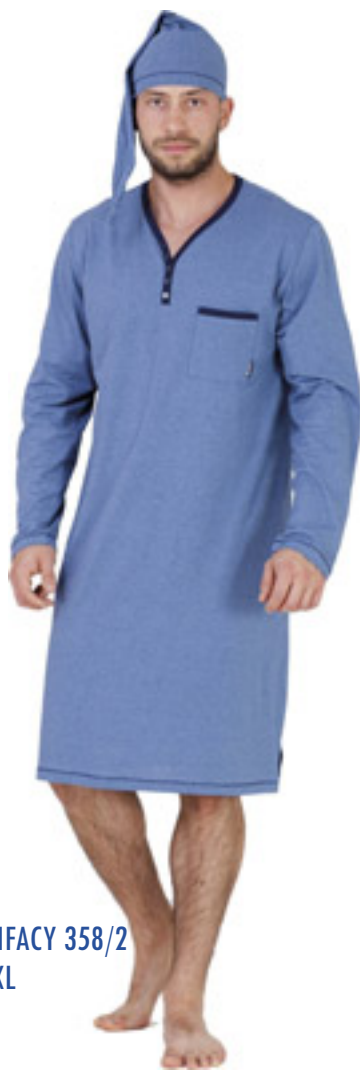
BONIFACY 358/2 M-4XL