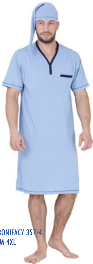
BONIFACY 357/4 M-4XL