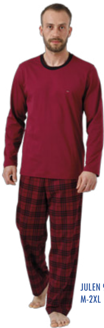
JULEN 992/2 M-2XL