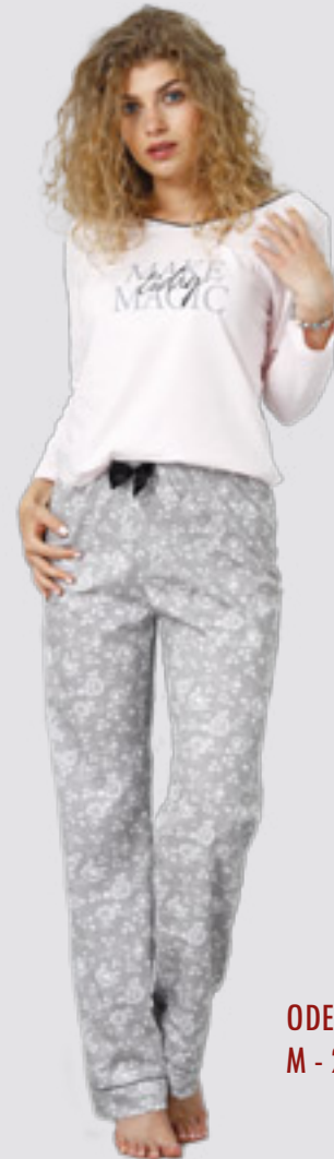
OGETTA 941 M - 2XL