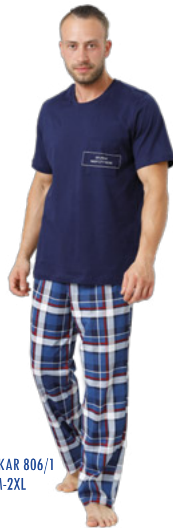
IKAR 806/1 M-2XL