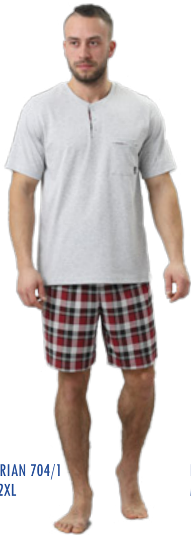
DORIAN 704/1 M-2XL