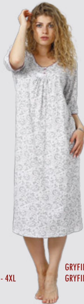
GRYFINA 885 M - 2XL GRYFINA 902 ++SIZE 3XL - 4XL