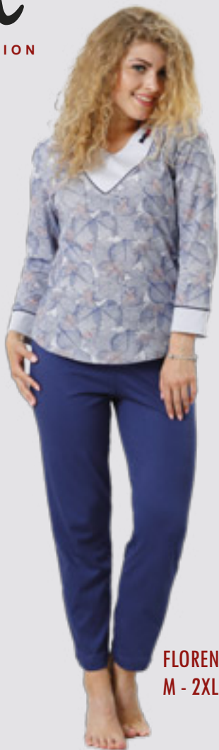
FLORENCJA 811 M - 2XL