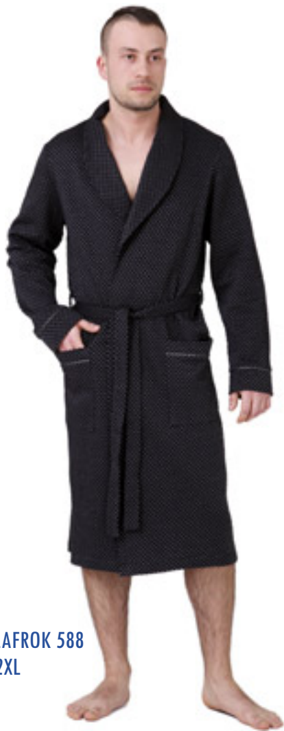
SZLAFROK 588 M-2XL