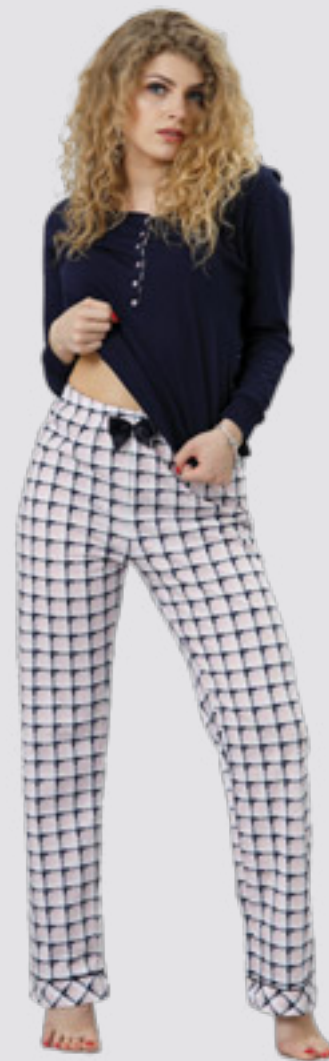
IDEA 769 S - 2XL