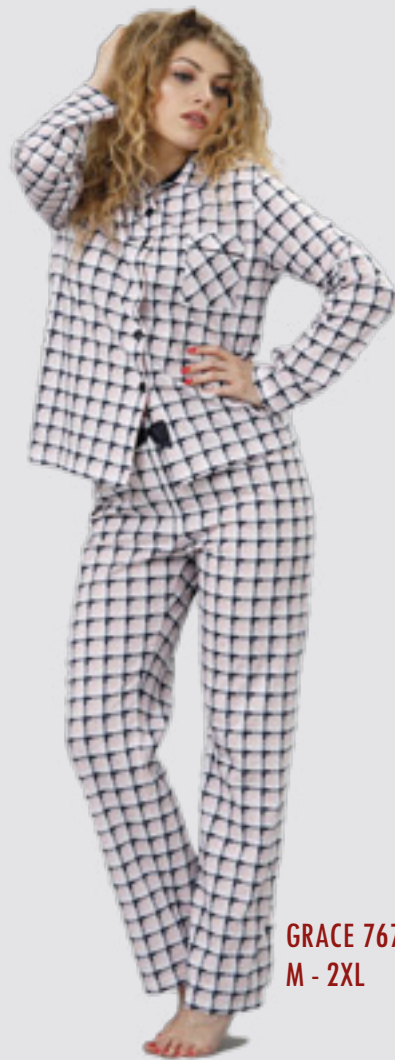
GRACE 767 M - 2XL