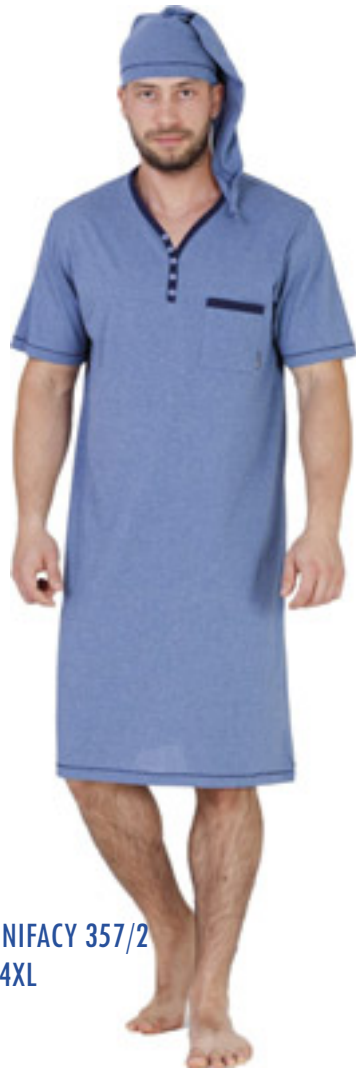
BONIFACY 357/2 M-4XL