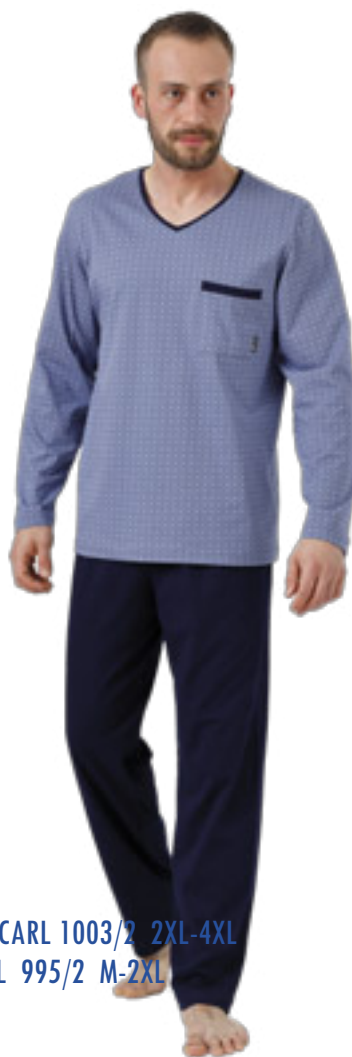
BIG CARL 1003/2 2XL-4XL CARL 995/2 M-2XL