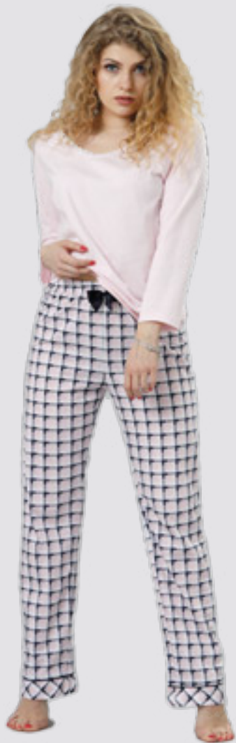
HOSSA 768 S - 2XL