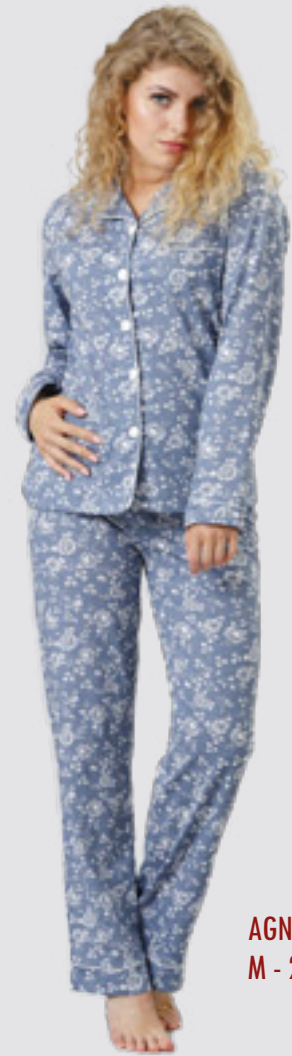
AGNES 798 M - 2XL