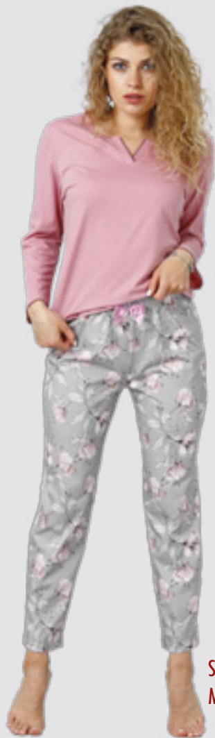
SAWANNA 969 M - 2XL