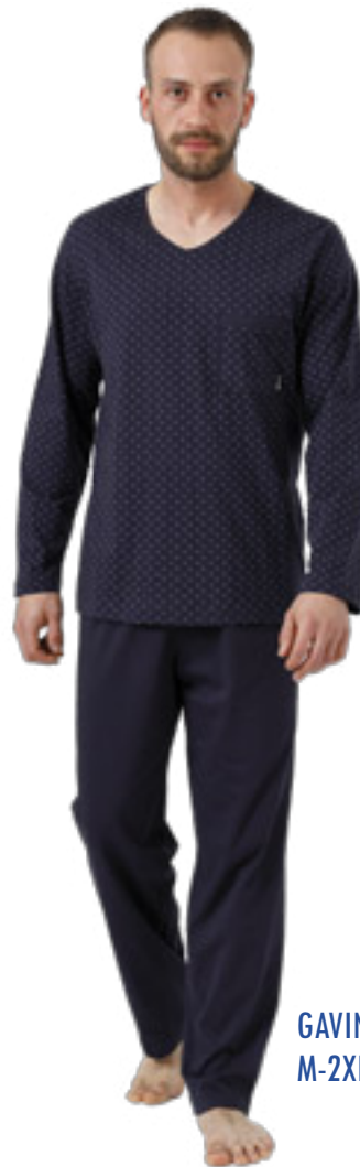
GAVIN 1001 M-2XL