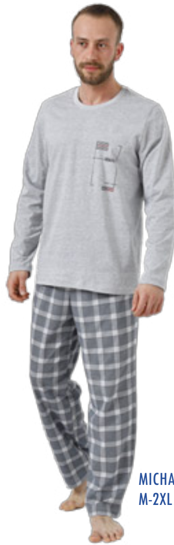
MICHAEL 986/2 M-2XL