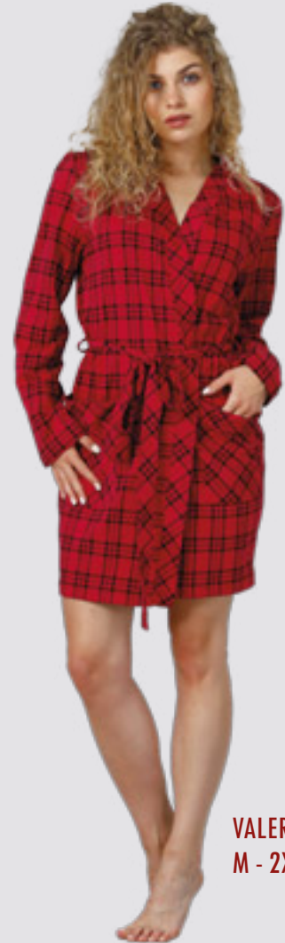
VALERIA 968 M - 2XL