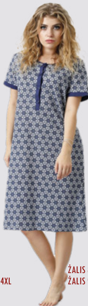
ŽALIS 881 M - 2XL ŽALIS 905++SIZE 3XL - 4XL