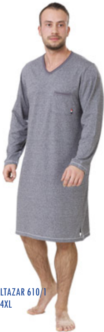
BALTAZAR 610/1 M-4XL