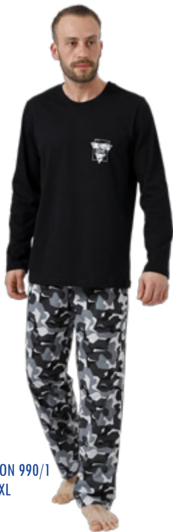
ANTON 990/1 M-2XL