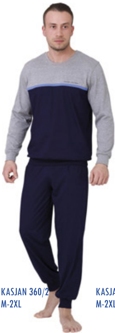
KASJAN 360/2 M-2XL