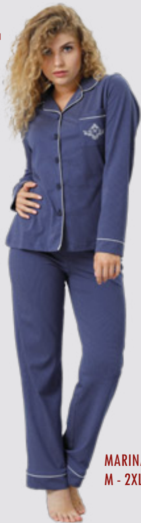
MARINA 794 M - 2XL