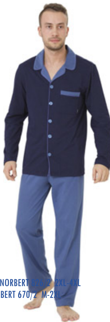
BIG NORBERT 826/2 2XL-4XL NORBERT 670/2 M-2XL