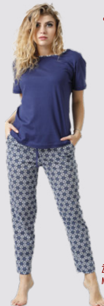
ŽAKSA 883 M - 2XL