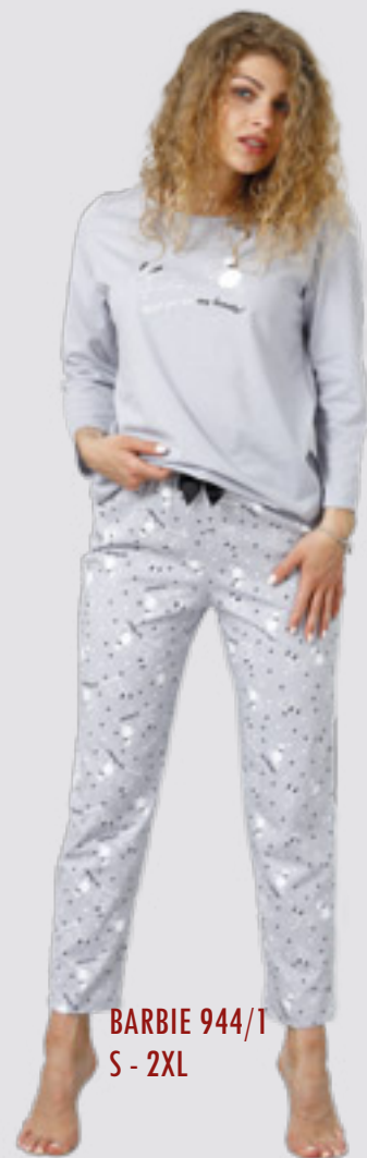
BARBIE 944/T S - 2XL