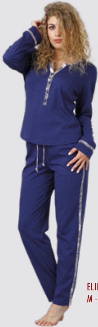
ELIF 938 M - 2XL