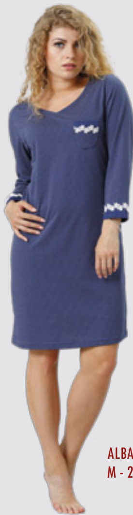
ALBA 799 M - 2XL