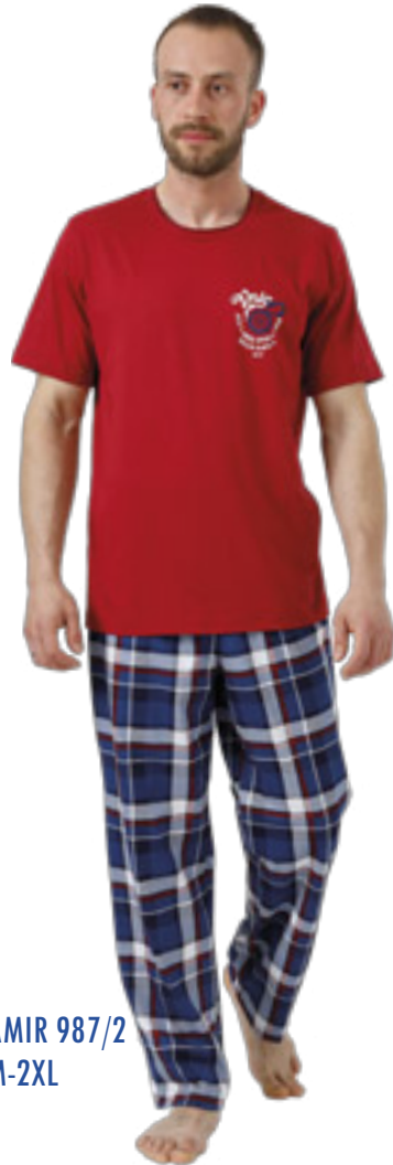
AMIR 987/2 M-2XL