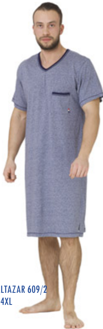
BALTAZAR 609/2 M-4XL