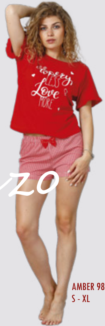
AMBER 982 S - XL