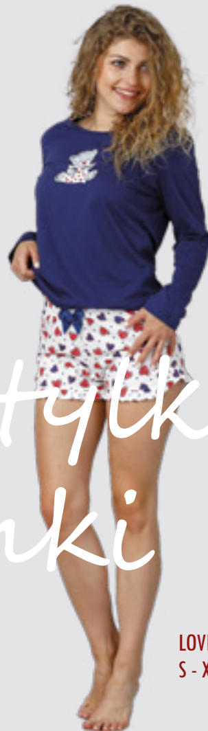
LOVELLA 998 S - XL