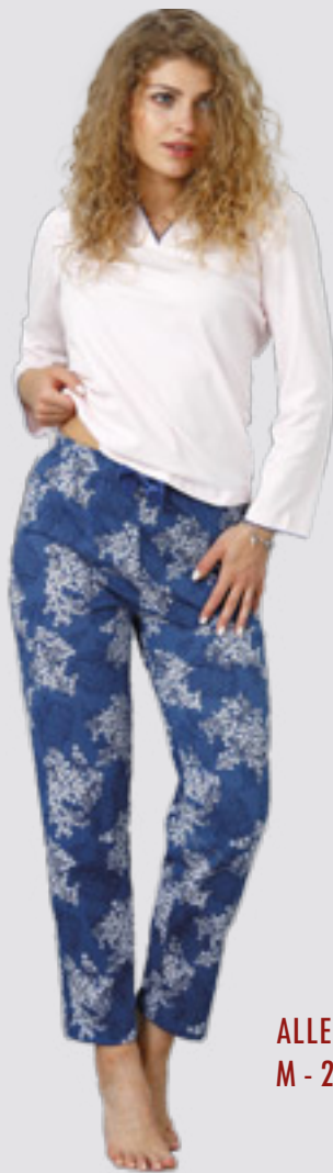
ALLEGRA 953/1 M - 2XL