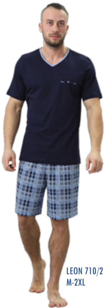
LEON 710/2 M-2XL