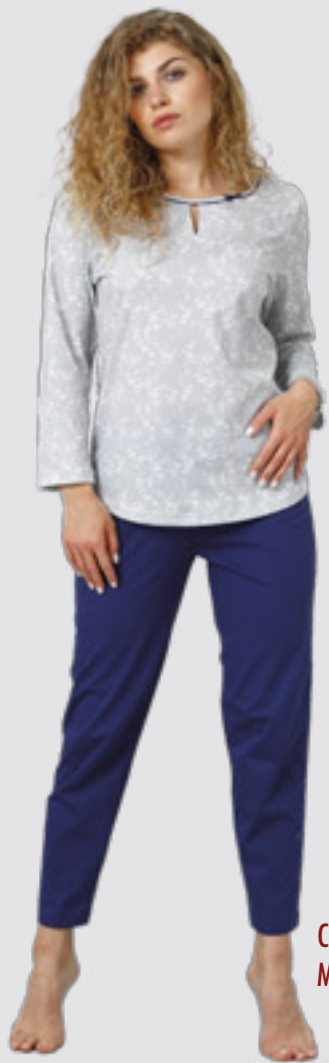
CONNIE 935 M - 2XL