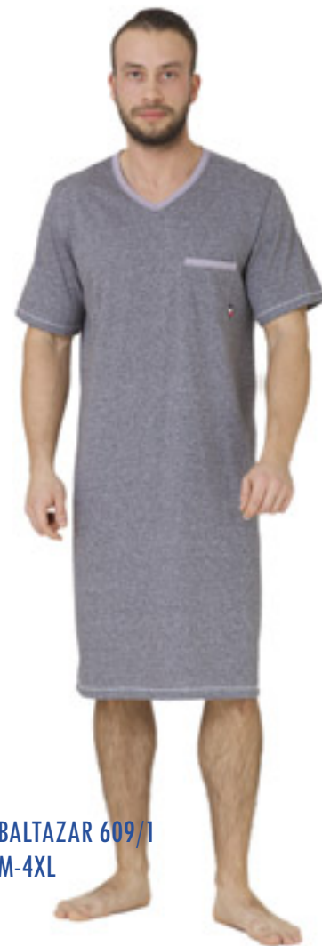
BALTAZAR 609/1 M-4XL