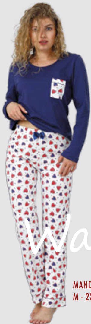
MANDI 999 M - 2XL