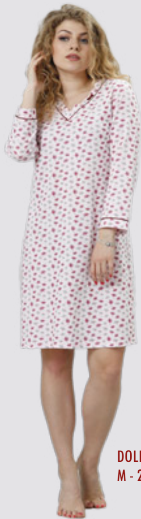
DOLLY 785 M - 2XL