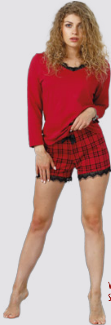
VIOLET 967 S - XL