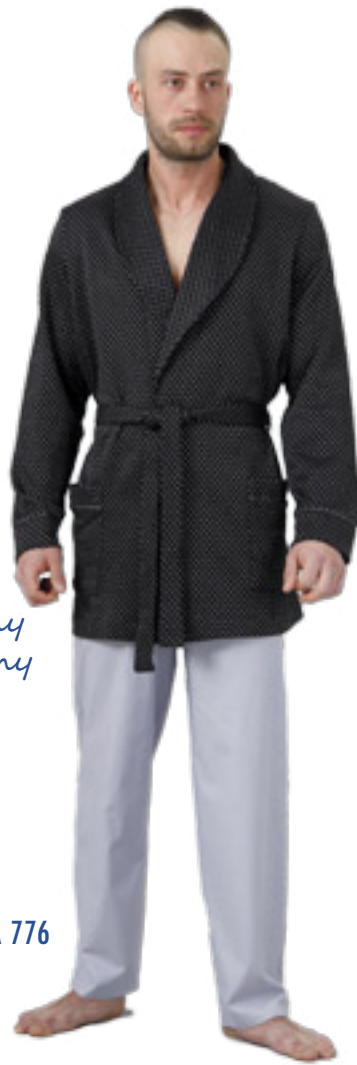
BONŻURKA 776 M-2XL