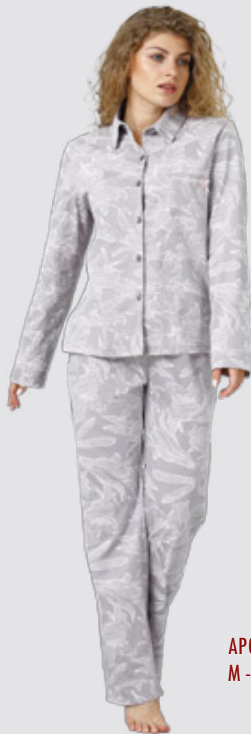
APOLONIA 956 M - 2XL