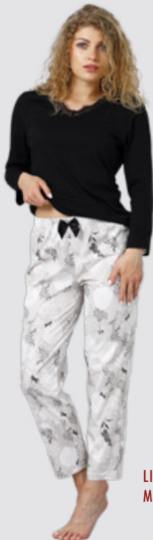
LIAM 964 M - 2XL