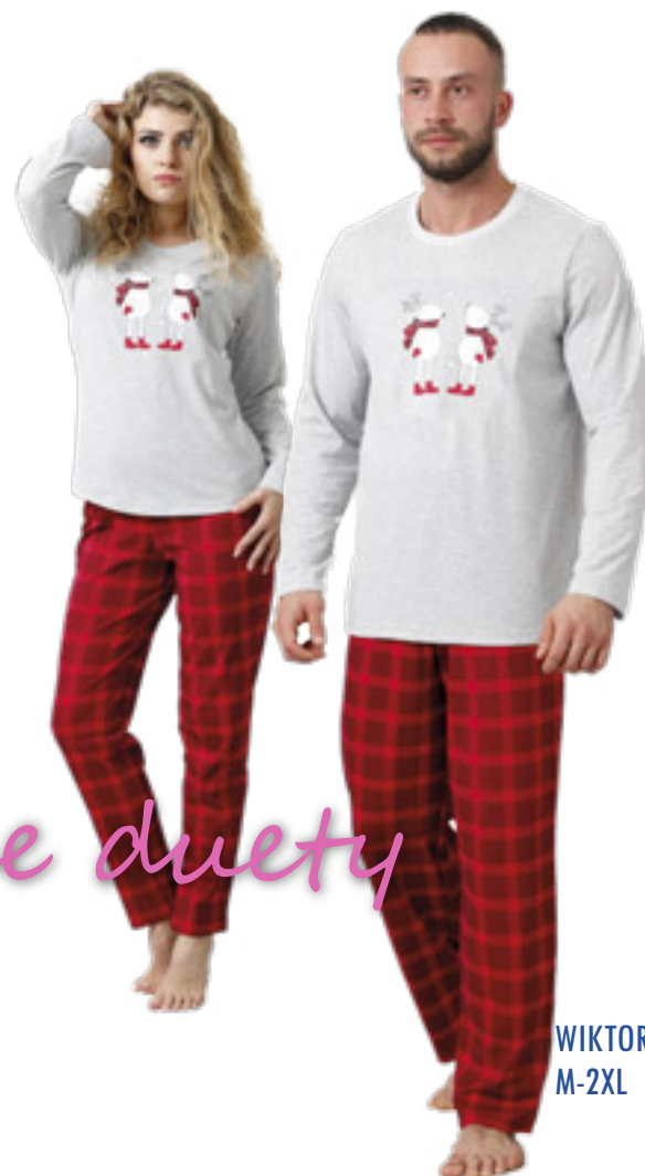
WIKTOR 838 M-2XL