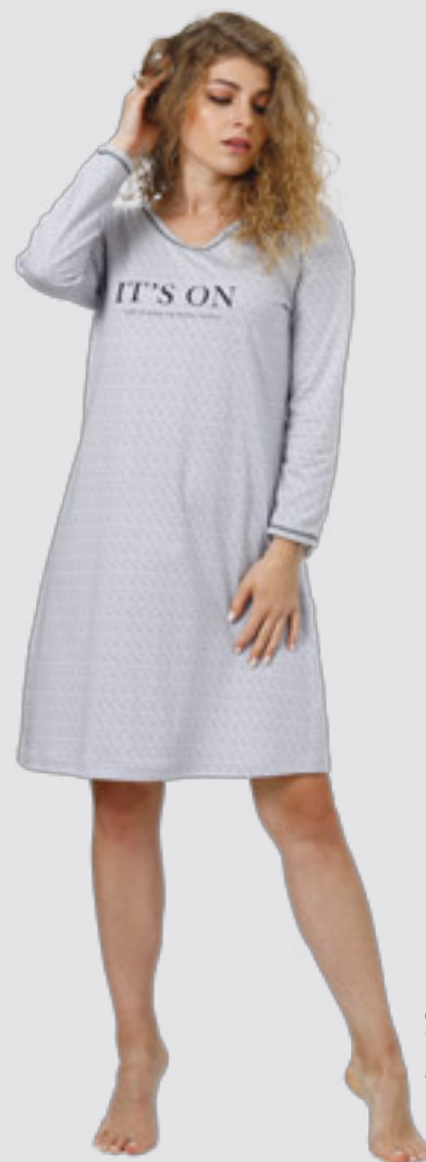
SABIN 960 M - 2XL