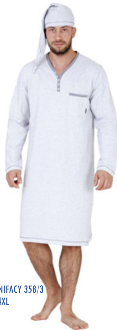
BONIFACY 358/3 M-4XL