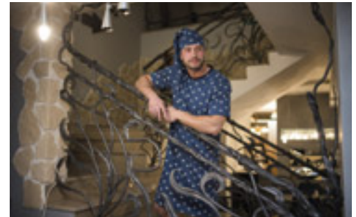
Luz i wygoda