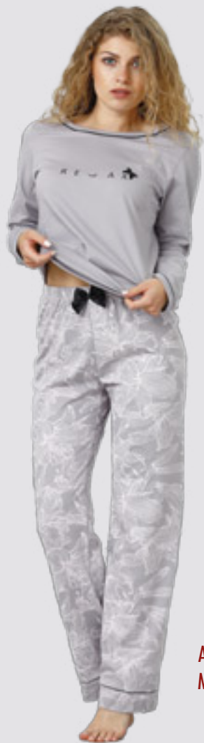
ARMINA 957 M - 2XL