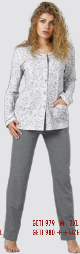
GETI 979 M - 2XL GETI 980 ++SIZE 3XL - 4XL