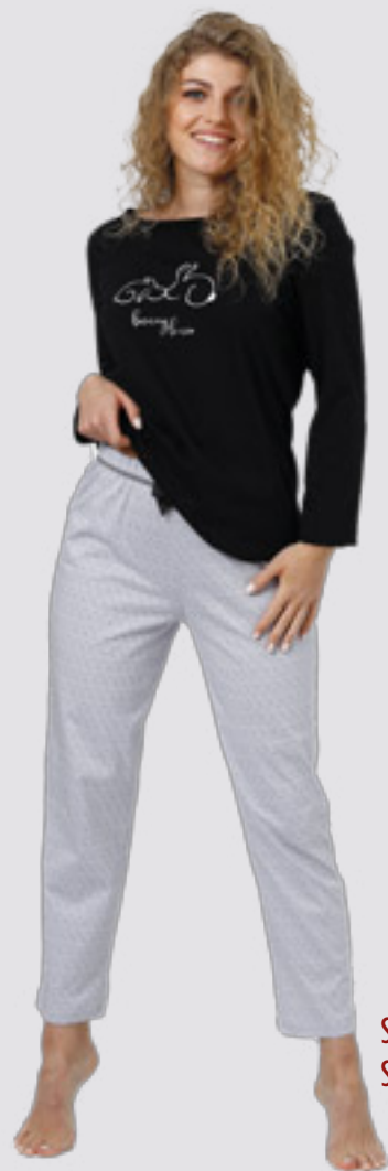
SKARLETT 959 S - 2XL