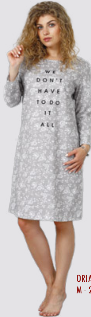
ORIANA 942 M - 2XL