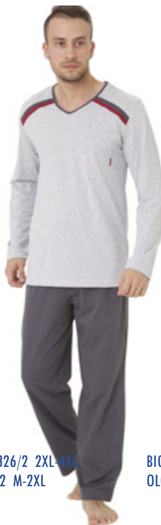
BIG OLO 326/2 2XL-4XL OLO 669/2 M-2XL