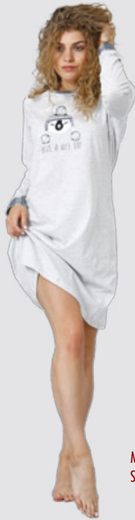
MAZILLA 948 S - 2XL