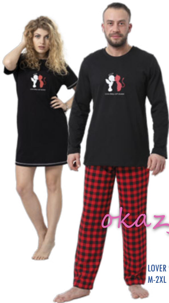
LOVER 908 M-2XL