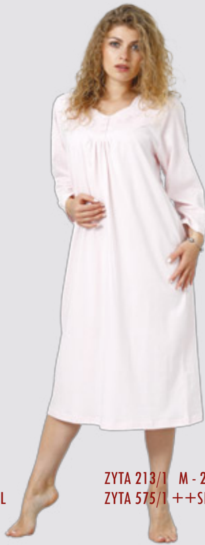
ZYTA 213/1 M - 2XL ZYTA 575/1 ++SIZE 3XL - 4XL