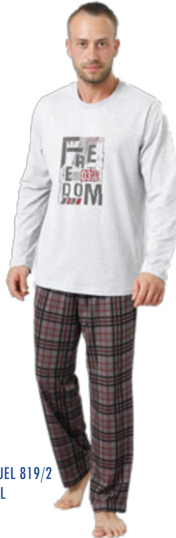
SAMUEL 819/2 M-2XL