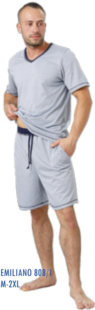
EMILIANO 808/1 M-2XL