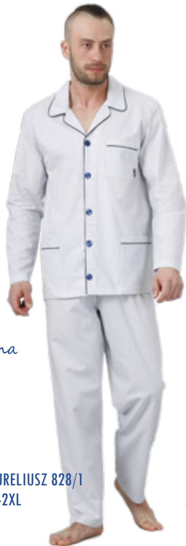
AURELIUSZ 828/1 M-2XL