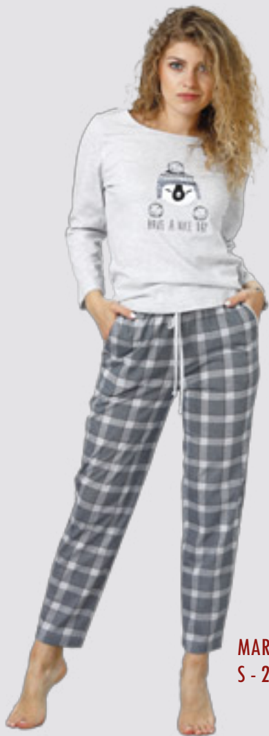
MARCJA 949 S - 2XL