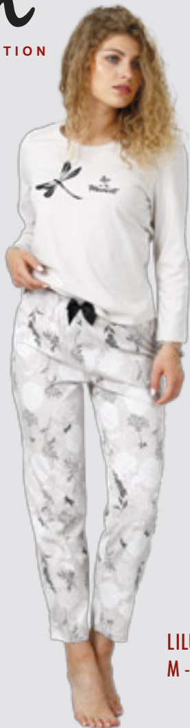
LILU 963 M - 2XL