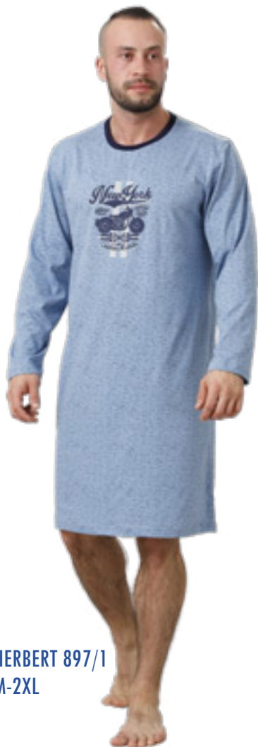
HERBERT 897/1 M-2XL