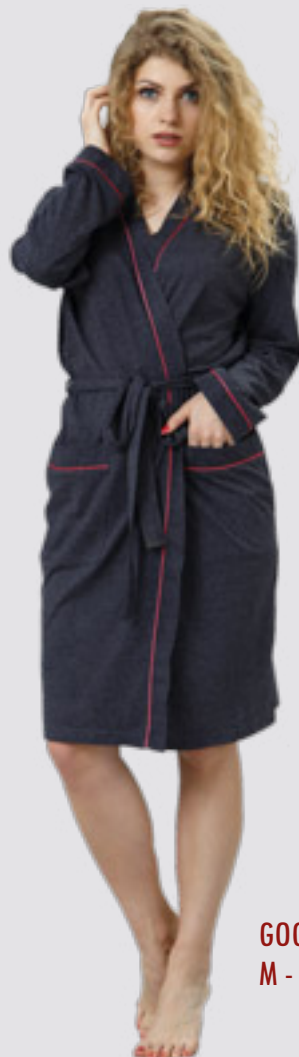
GOGA 775/2 M - 2XL