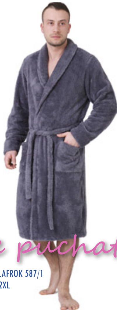
SZLAFROK 587/1 M-2XL