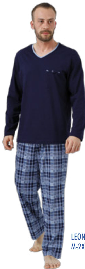
LEON 993/2 M-2XL