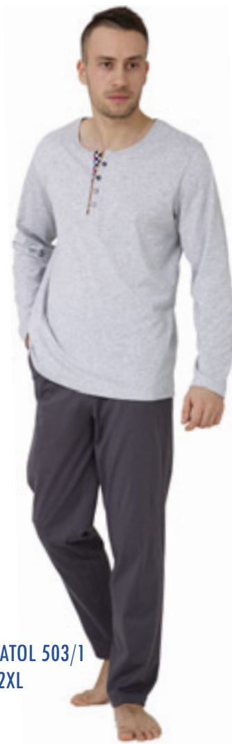
ANATOL 503/1 M-2XL