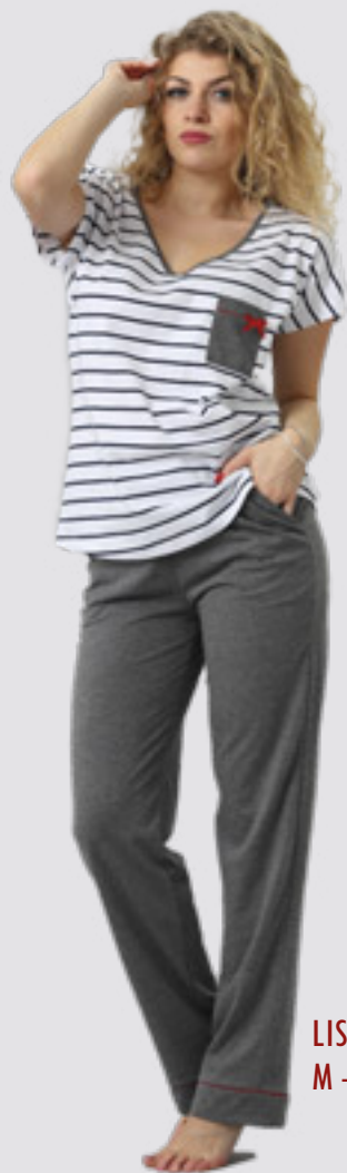
LISA 737 M - 2XL