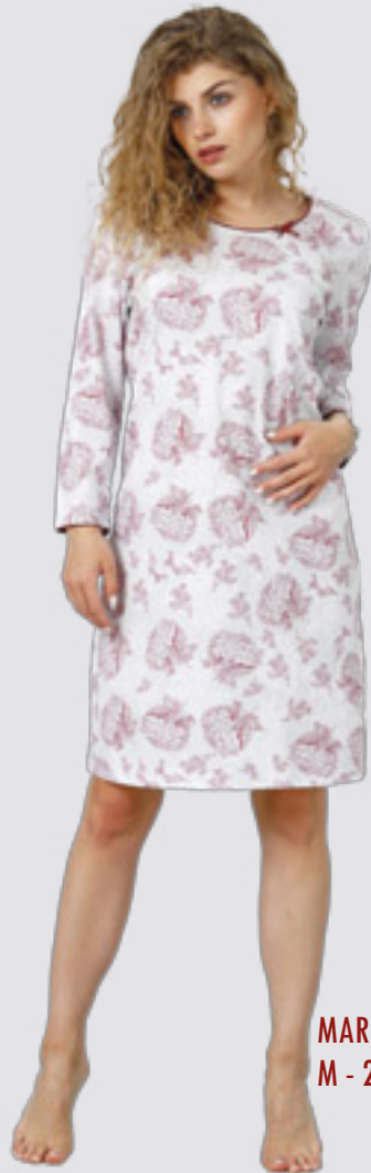
MARIA 930 M - 2XL