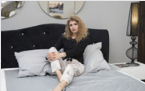
Elegancja i wygoda