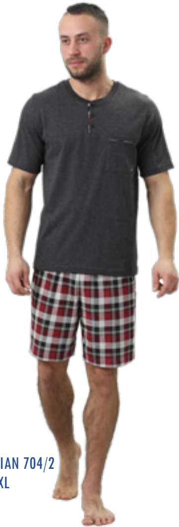
DORIAN 704/2 M-2XL