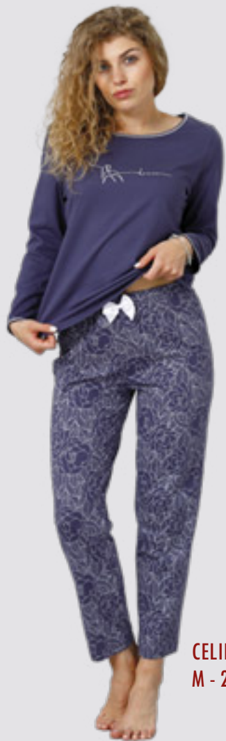
CELINE 952 M - 2XL