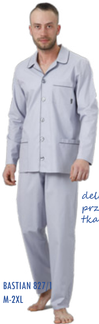
BASTIAN 827/1 M-2XL