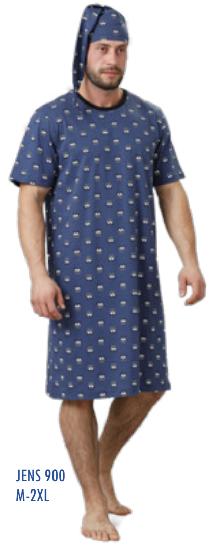
JENS 900 M-2XL