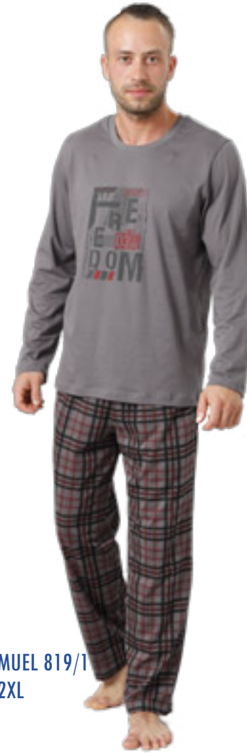
SAMUEL 819/1 M-2XL