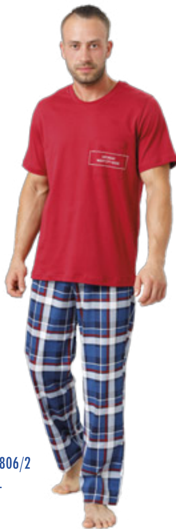
IKAR 806/2 M-2XL