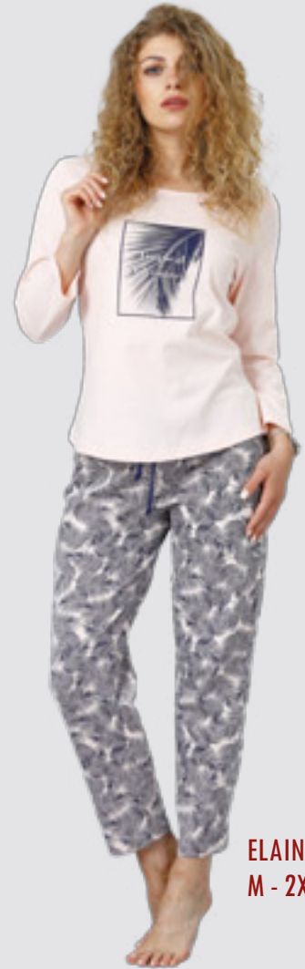
ELAIN 940 M - 2XL