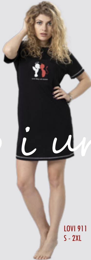
LOVI 911 S - 2XL