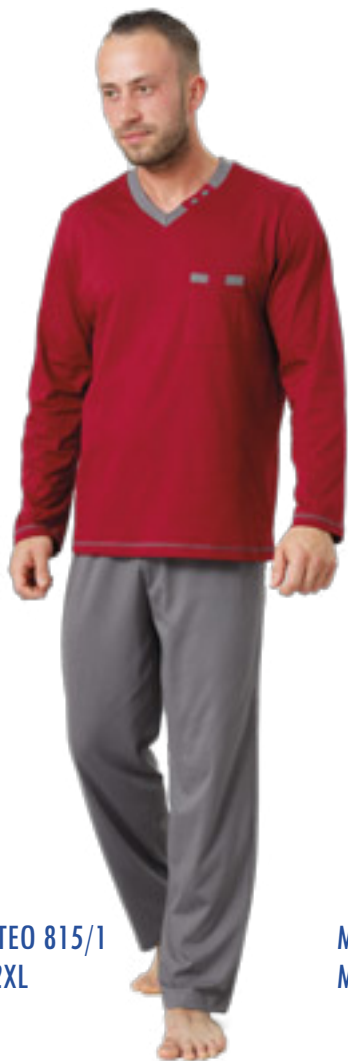
MATEO 815/1 M-2XL