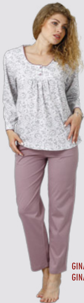
GINA 977 M - 2XL GINA 978 ++SIZE 3XL - 4XL