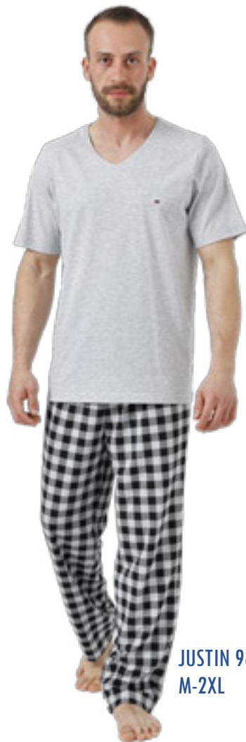
JUSTIN 985/1 M-2XL