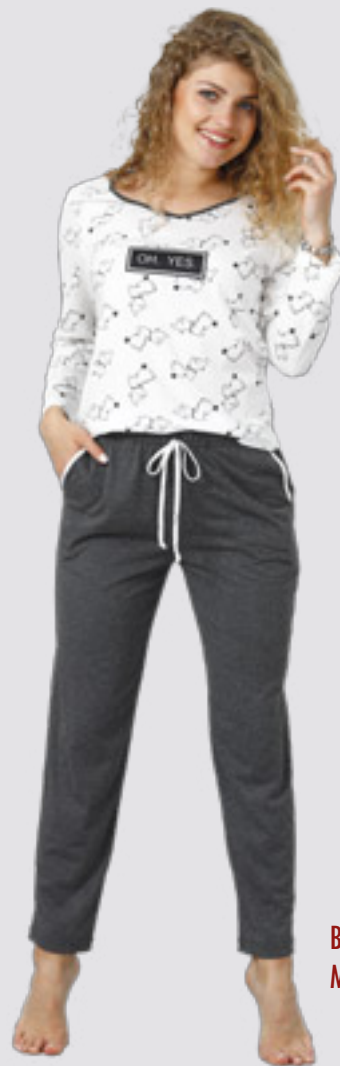
BIBIAN 961 M - 2XL