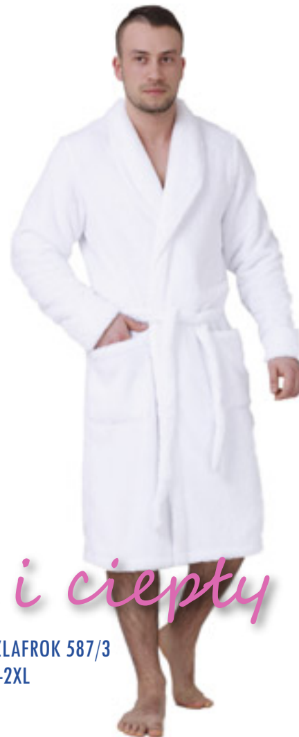
SZLAFROK 587/3 M-2XL