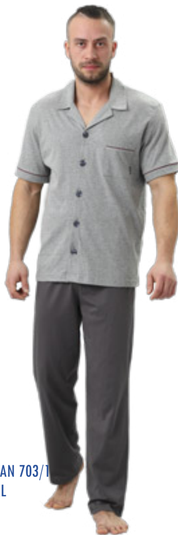
BRAJAN 703/1 M-2XL