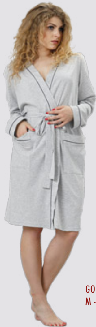
GOGA 775/1 M - 2XL