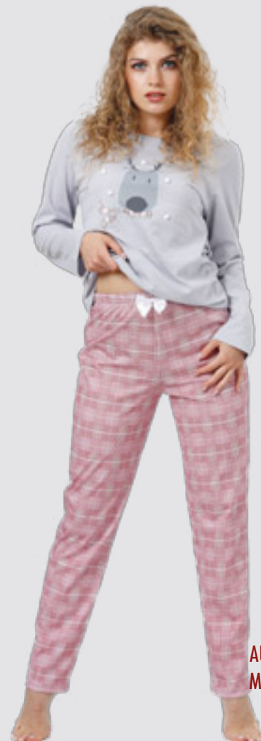
AUROLA 997 M - 2XL