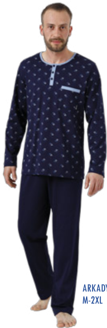
ARKADY 988/2 M-2XL