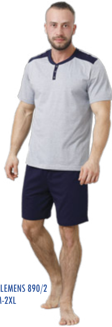
CLEMENS 890/2 M-2XL