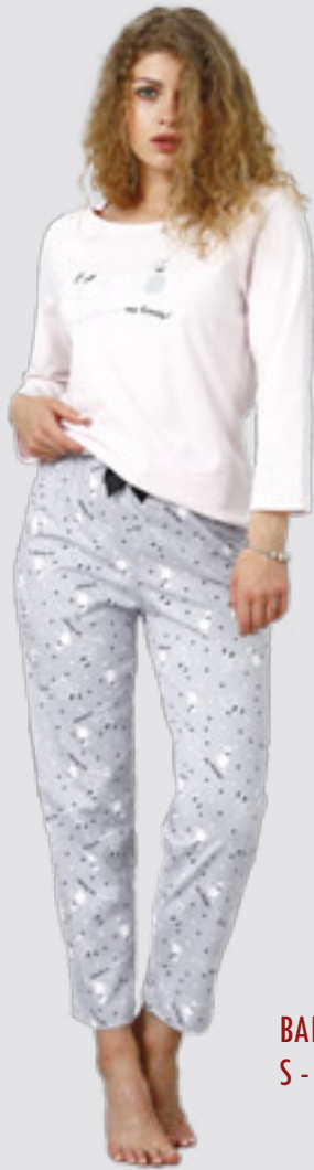
BARBIE 944/2 S - 2XL