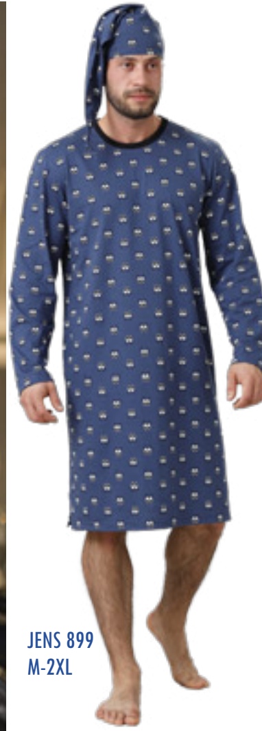
JENS 899 M-2XL