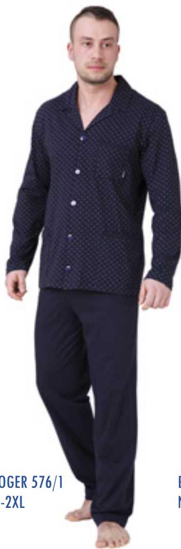
ROGER 576/1 M-2XL