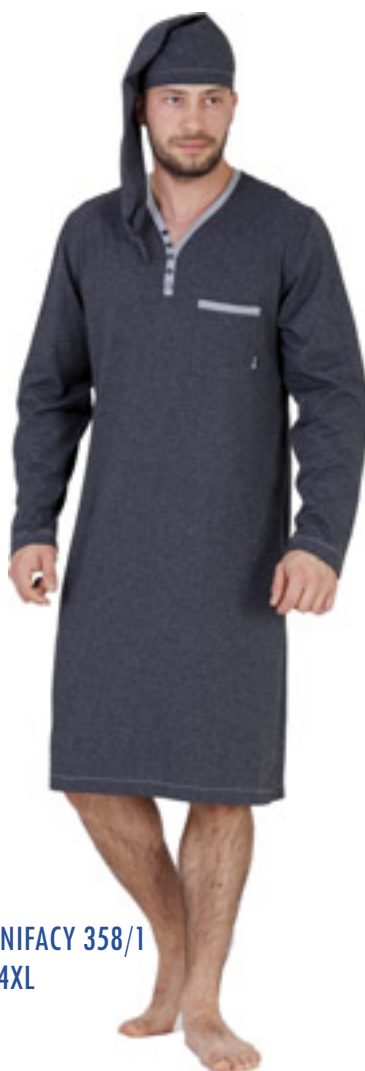
BONIFACY 358/1 M-4XL