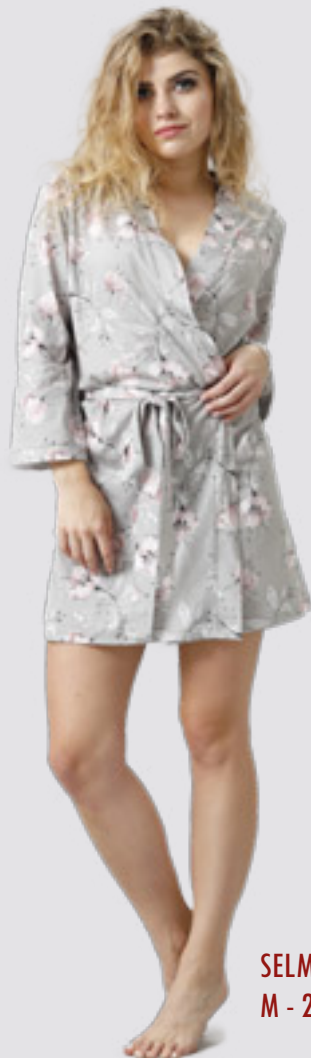
SELMA 869 M - 2XL