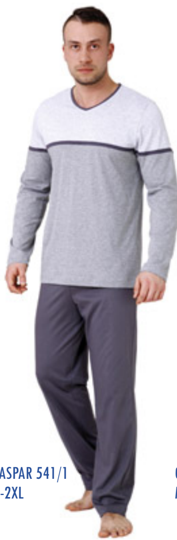
GASPAR 541/1 M-2XL