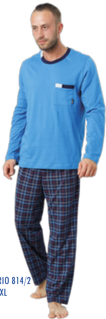
MARIO 814/2 M-2XL