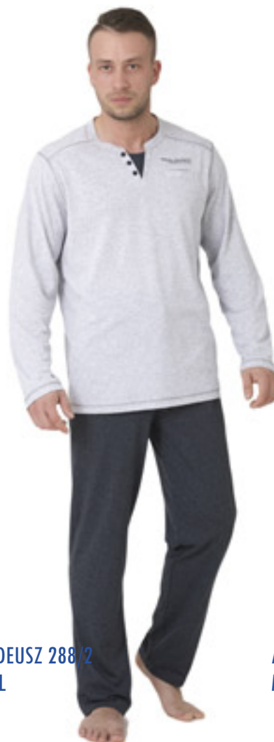
AMADEUSZ 288/2 M-2XL