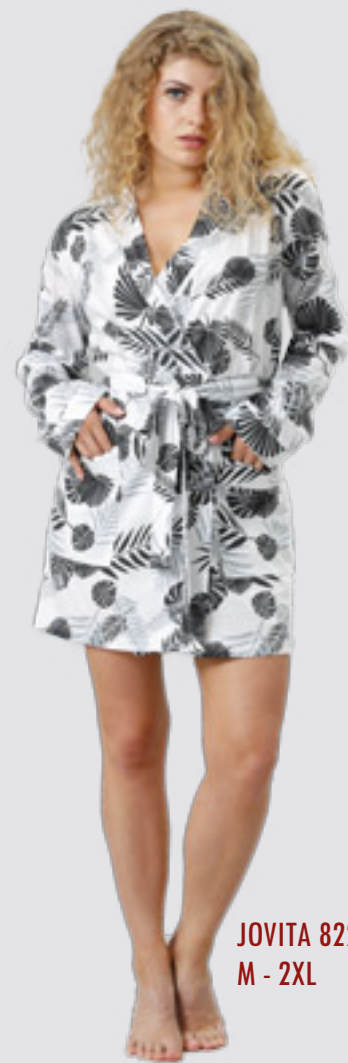
JOVITA 822 M - 2XL