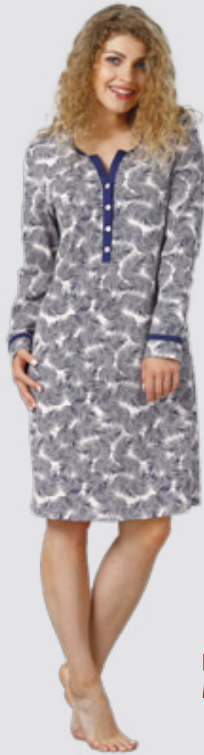
EMINE 939 M - 2XL