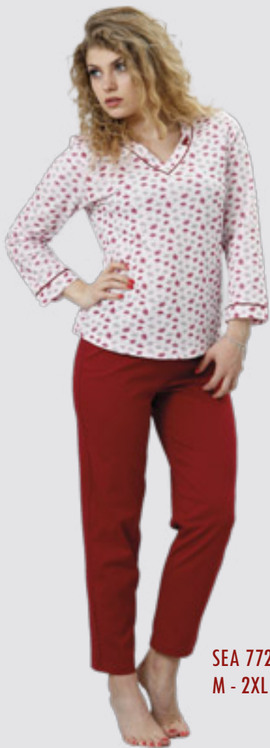
SEA 772 M - 2XL