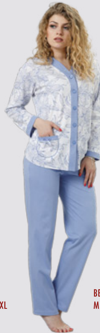
BECKY 773 M - 2XL