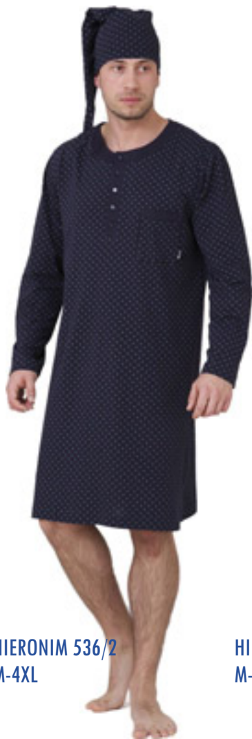
HIERONIM 536/2 M-4XL