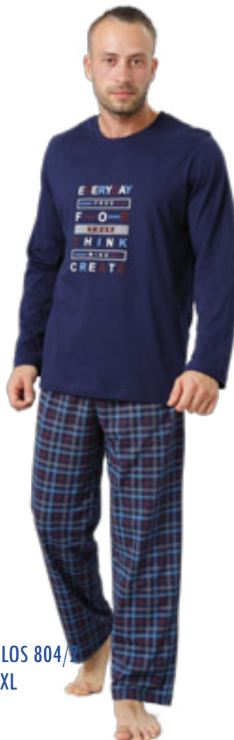
CARLOS 804/2 M-2XL