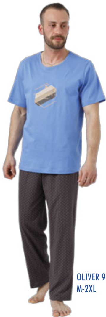
OLIVER 994/1 M-2XL