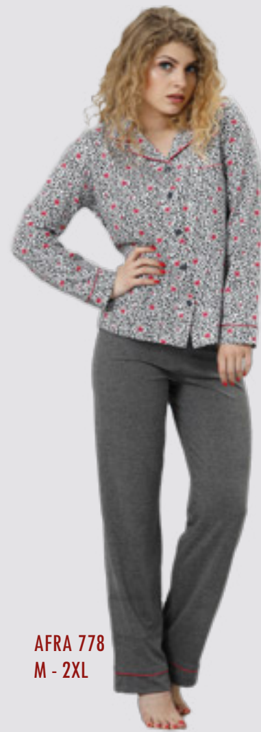
AFRA 778 M - 2XL