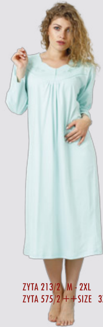
ZYTA 213/2 M - 2XL ZYTA 575/2 ++SIZE 3XL - 4XL