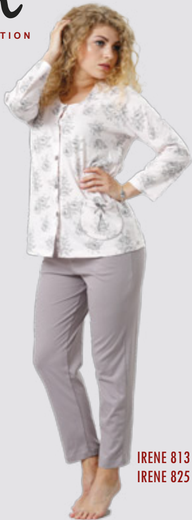
IRENE 813 M - 2XL IRENE 825 ++SIZE 3XL - 4XL