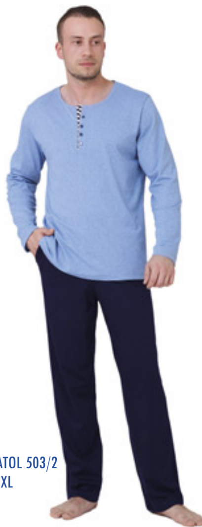
ANATOL 503/2 M-2XL