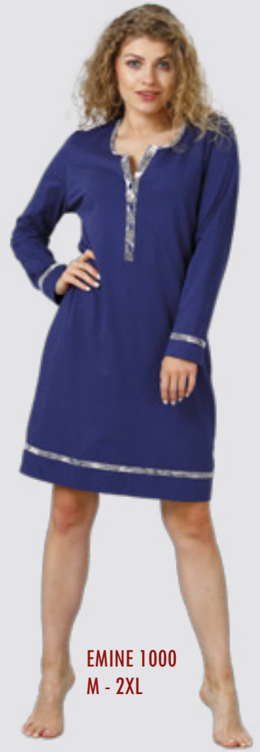
EMINE 1000 M - 2XL