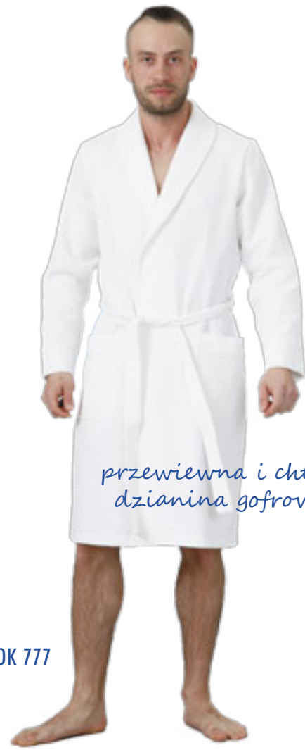
SZLAFROK 777 M-2XL