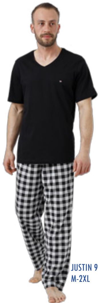
JUSTIN 985/2 M-2XL