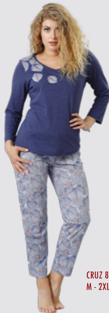
CRUZ 805 M - 2XL