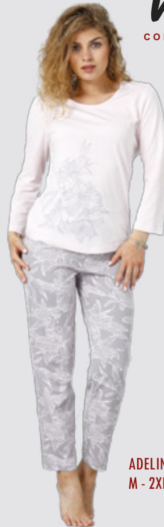
ADELINA 955 M - 2XL