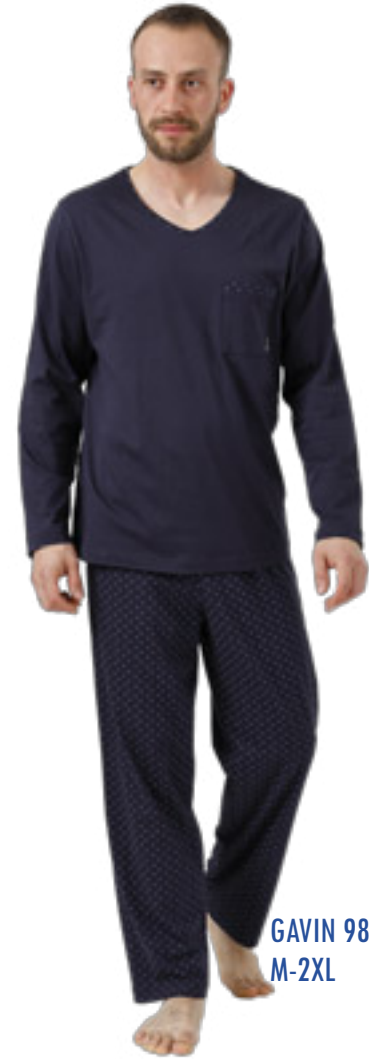
GAVIN 989 M-2XL