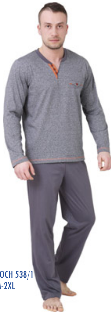
ROCH 538/1 M-2XL