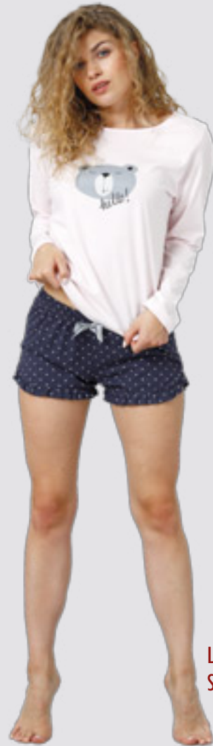
LETYCJA 926 S - XL