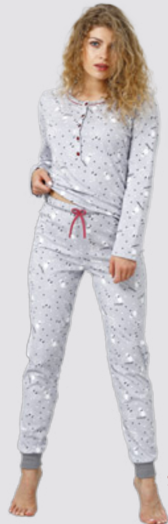
BRENDA 946 S - 2XL