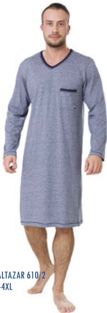
BALTAZAR 610/2 M-4XL