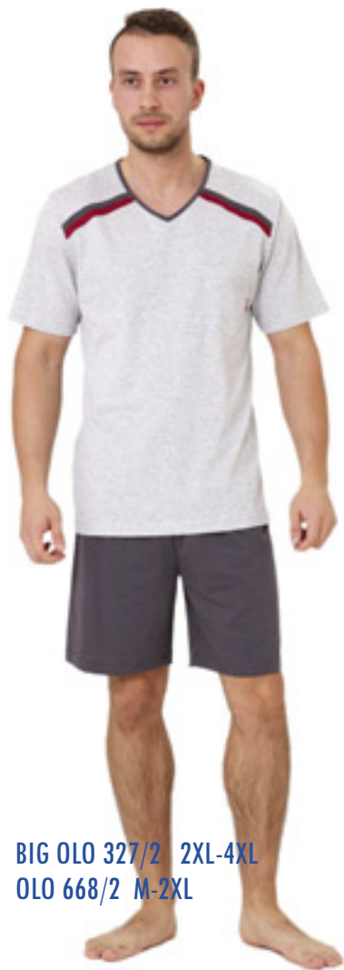
BIG OLO 327/2 2XL-4XL OLO 668/2 M-2XL