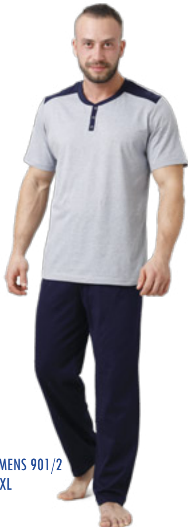
CLEMENS 901/2 M-2XL