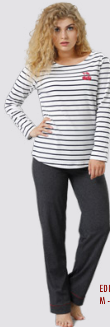
EDITTA 792 M - 2XL