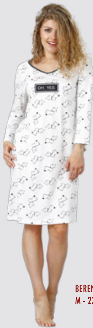
BERNIKA 962 M - 2XL