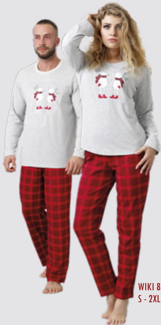
WIKI 835 S - 2XL