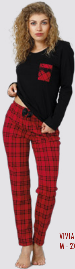
VIVIAN 966 M - 2XL