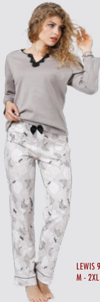
LEWIS 965 M - 2XL