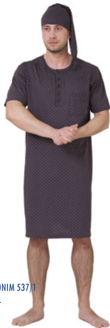
HIERONIM 537/1 M-4XL