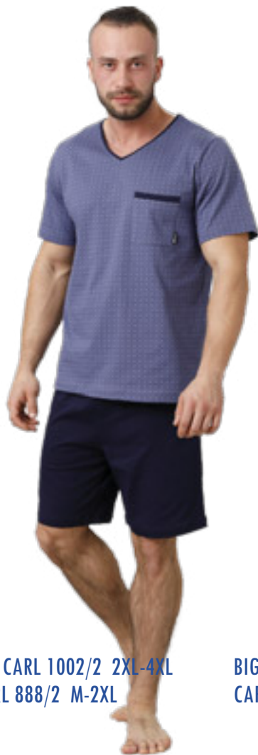
BIG CARL 1002/2 2XL-4XL CARL 888/2 M-2XL