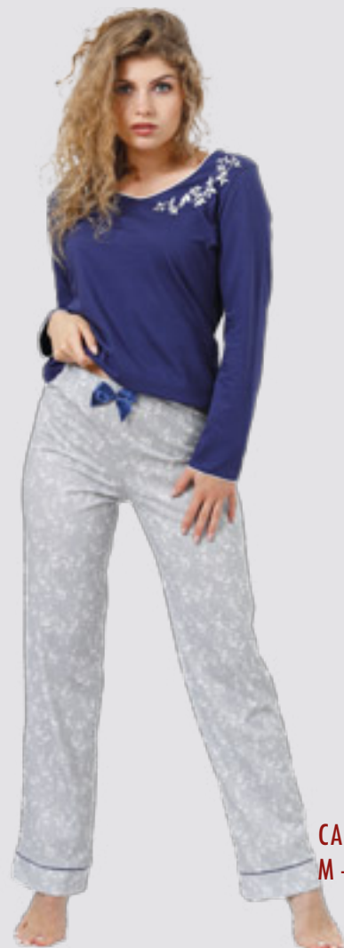
CAROLINE 937 M - 2XL