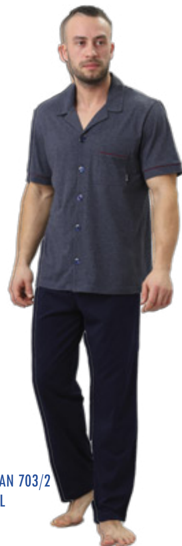
BRAJAN 703/2 M-2XL