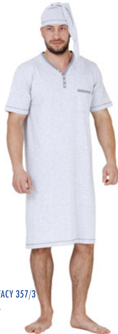
BONIFACY 357/3 M-4XL