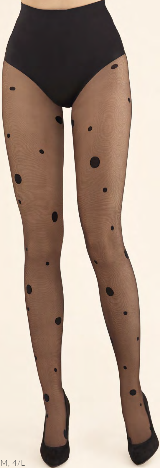
Dalma code 468