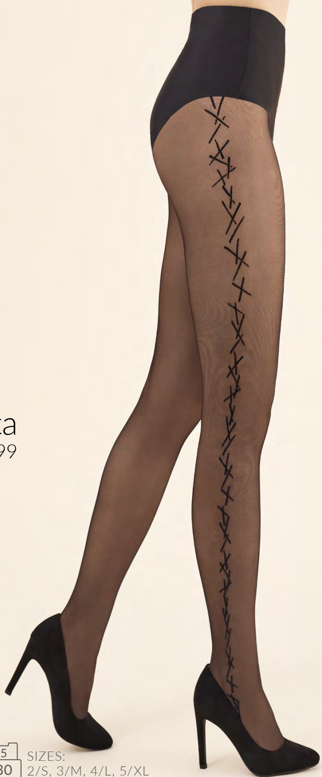
Nitta code 399