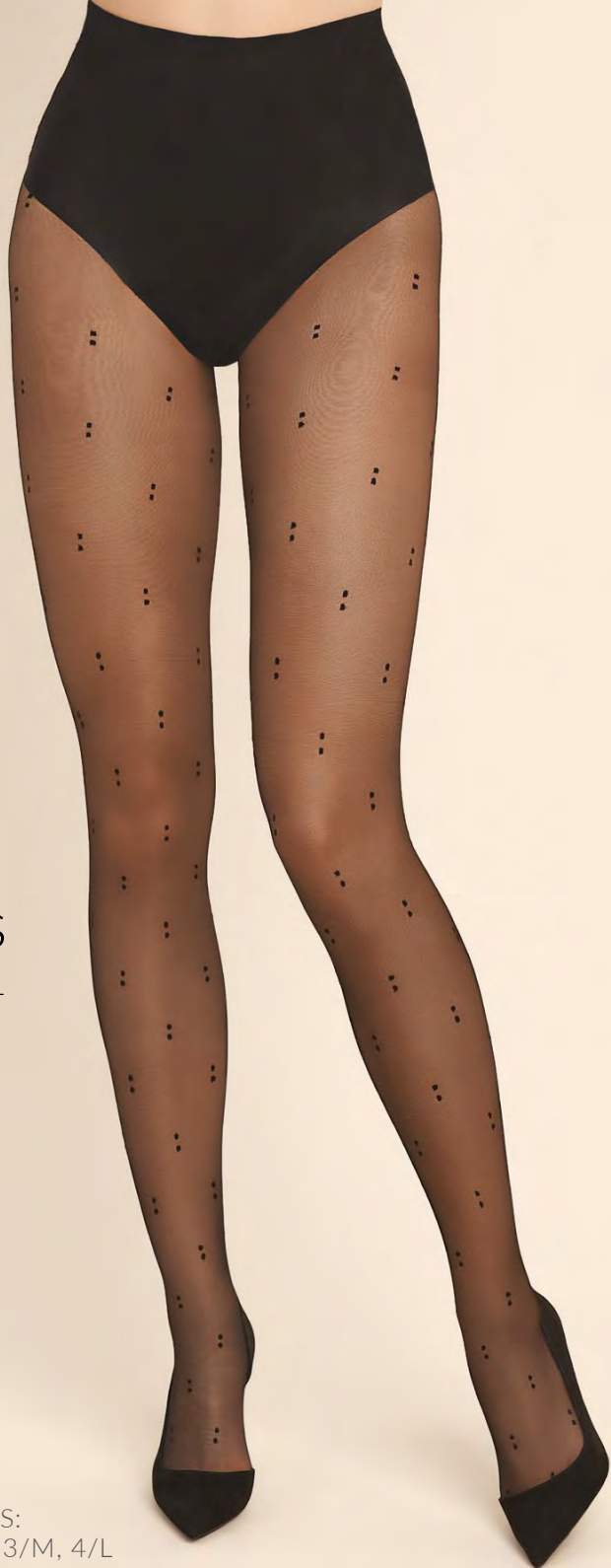
Dots code 491