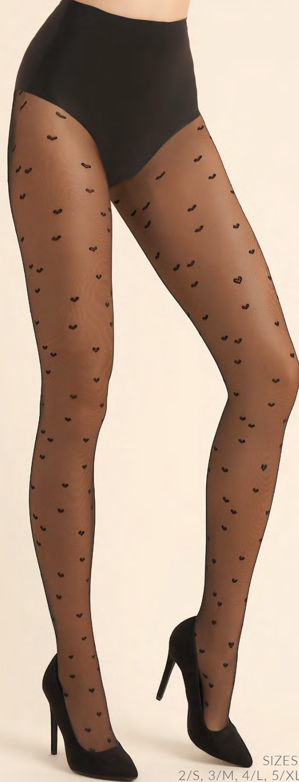
Lovie code 492