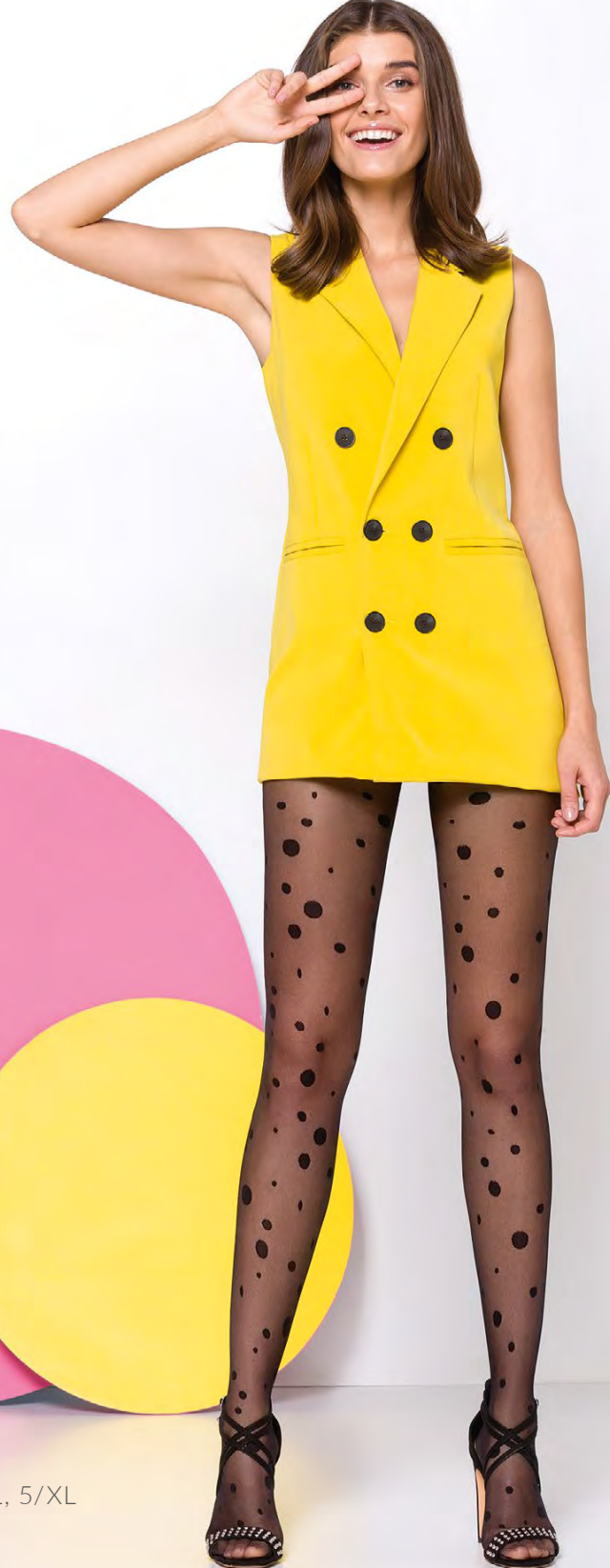
tabela rozmiarowa / size chart