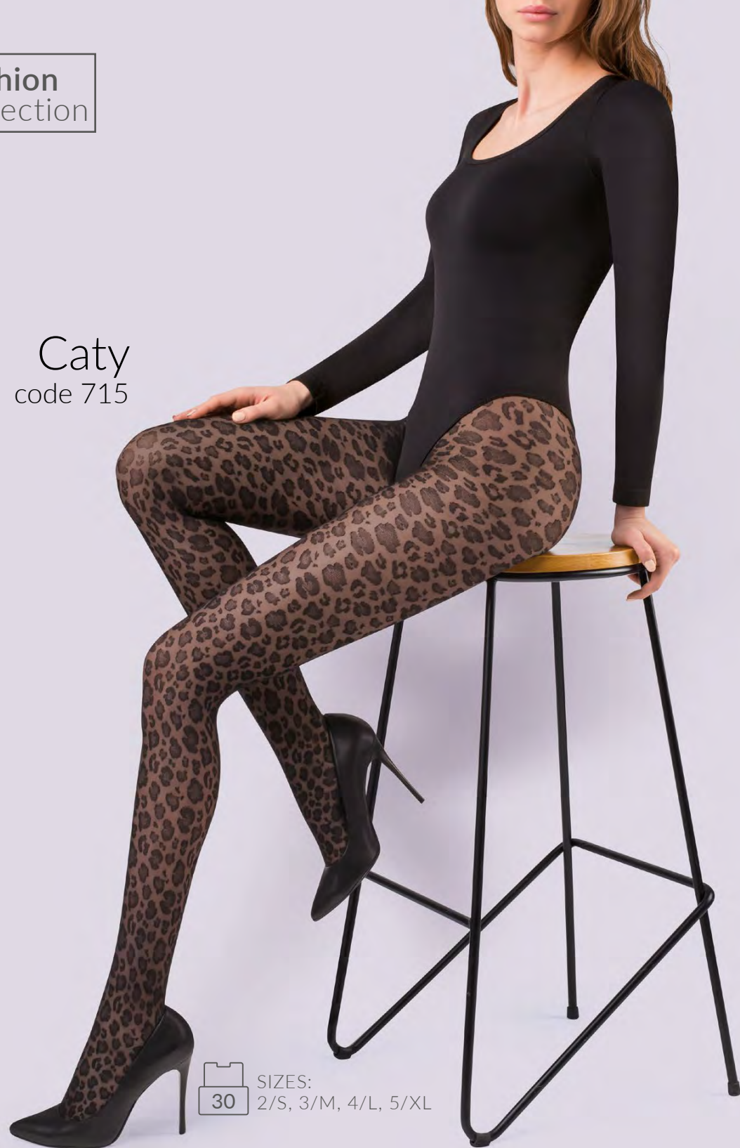
Caty code 715